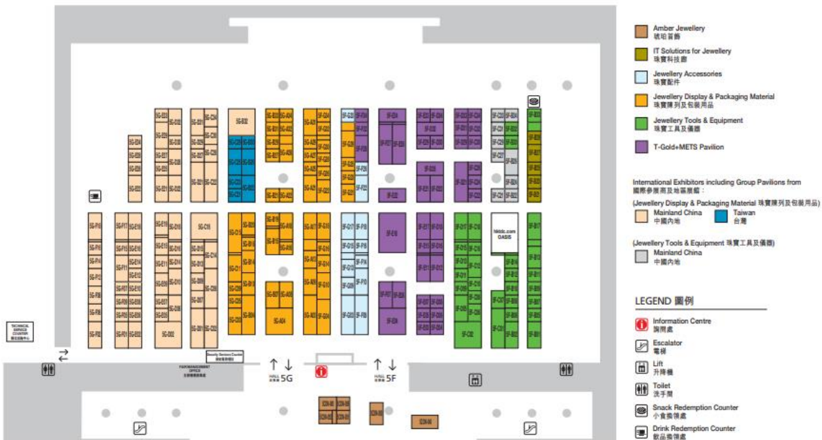
Plano de las salas 5F-G.