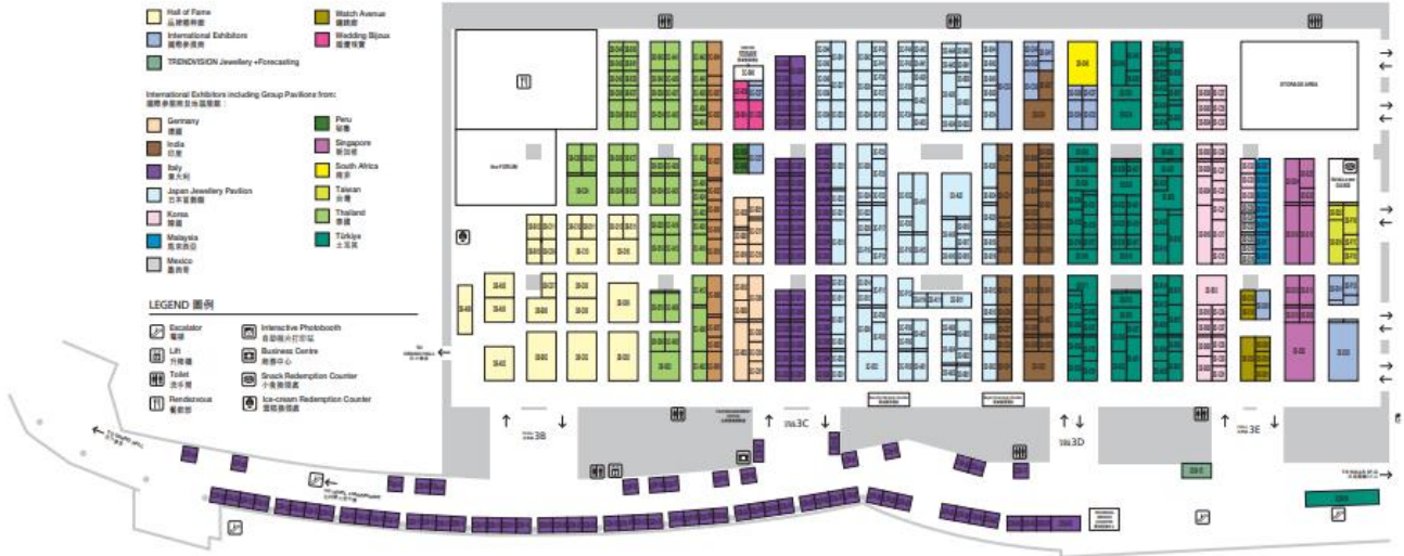
Plano de las salas 3B-E.