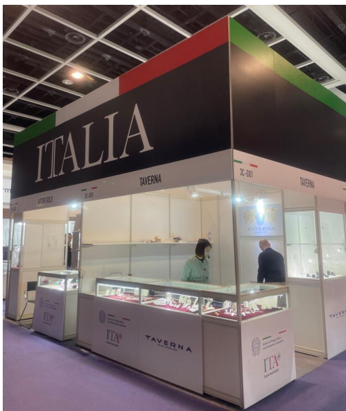
IMAGEN 3: STAND ITALIA Y TURQUÍA

Entre los principales países competidores, destacan por su fuerte presencia en la feria los pabellones de Turquía, Japón, Italia y Alemania