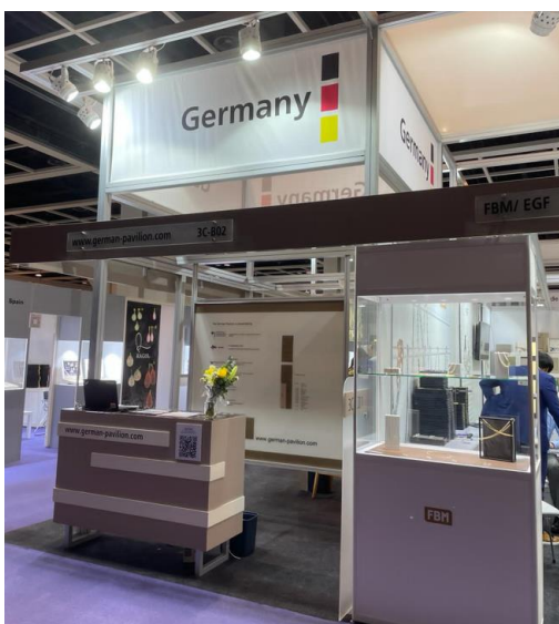
IMAGEN 4: STAND ALEMANIA