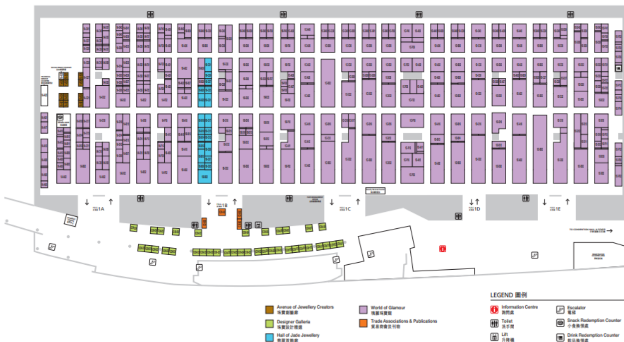
Plano de las salas 1A-E.