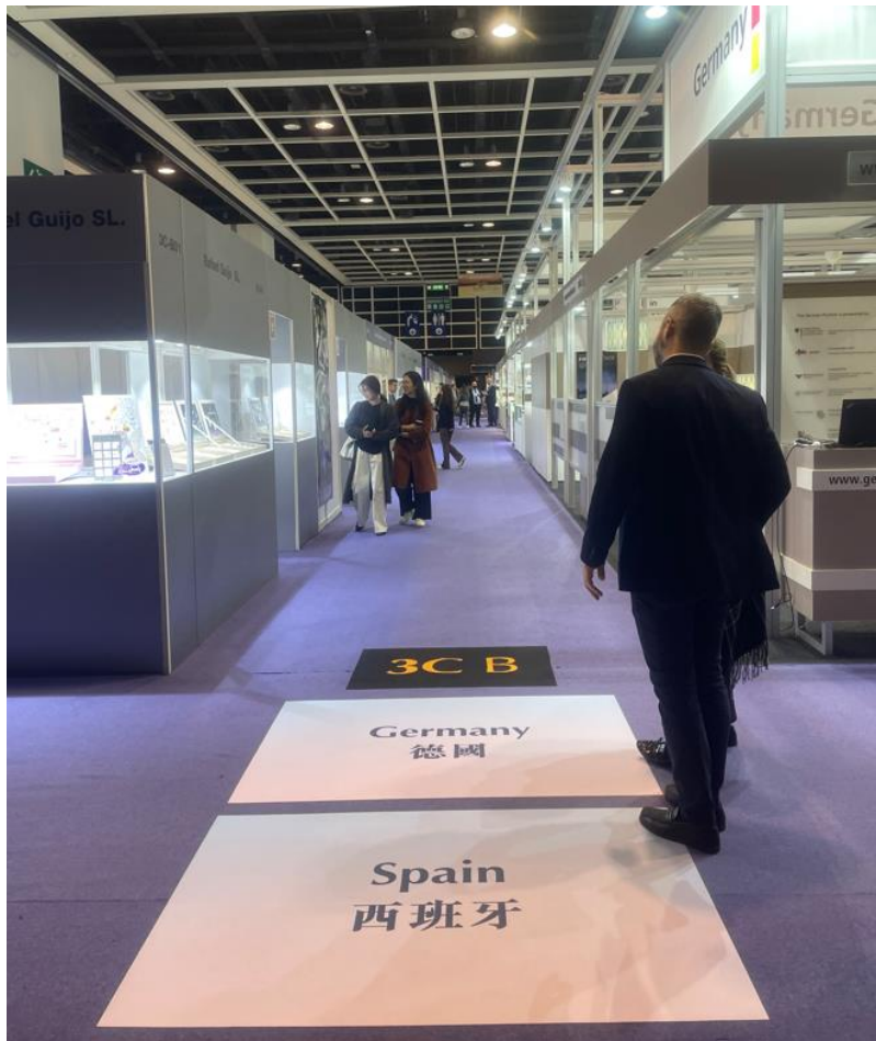
IMAGEN 1: PASILLO DE LOS STANDS DE ESPAÑA