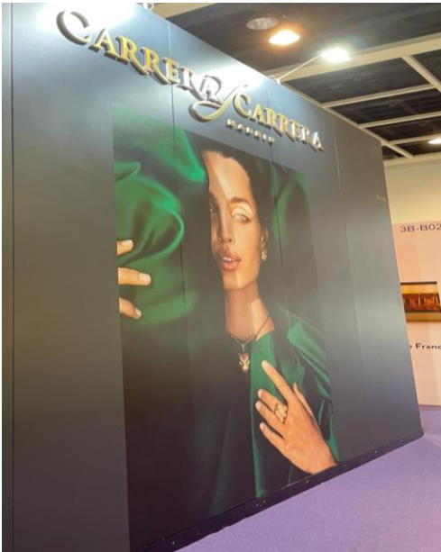
IMAGEN 2: STAND CARRERA & CARRERA