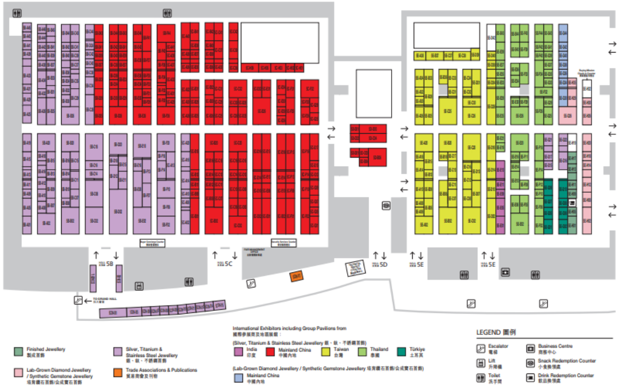
Plano de las salas 5B-E.