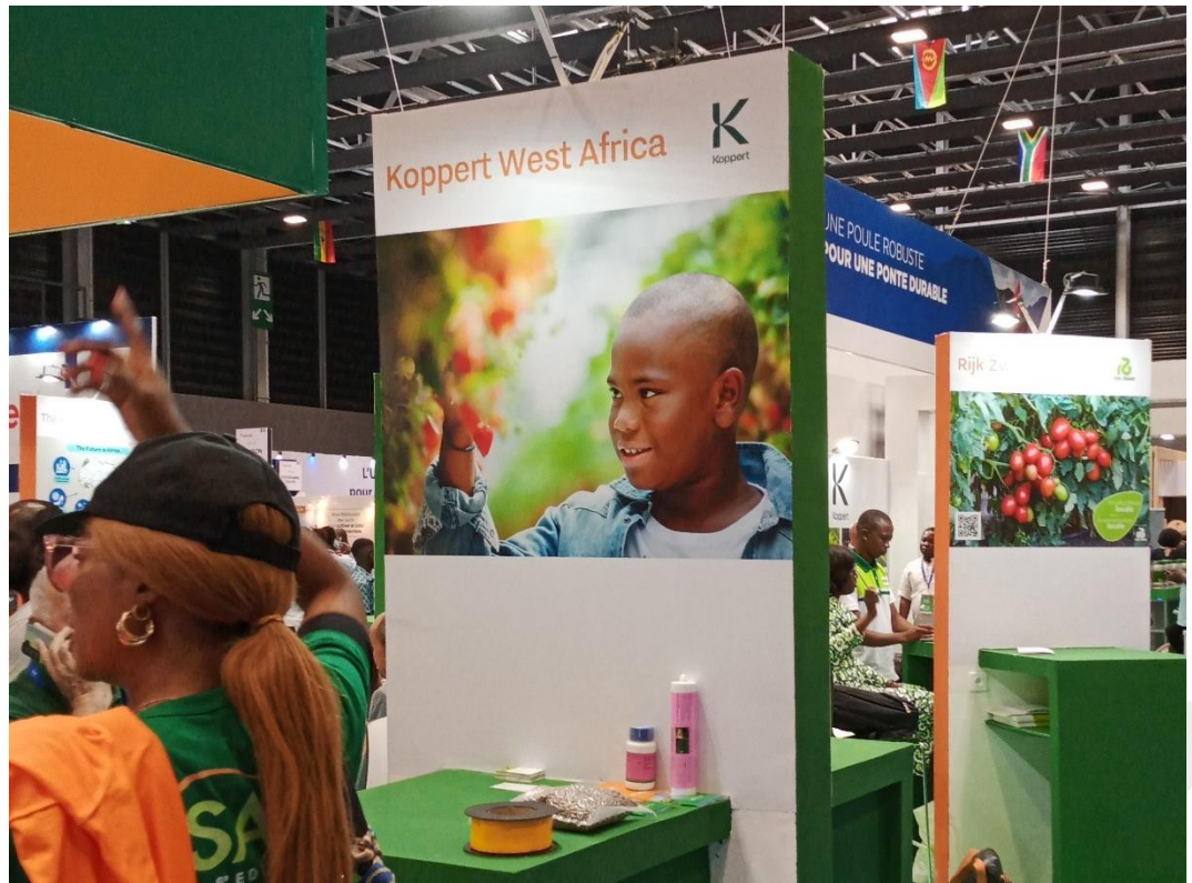
Pabellón Oficial de Países Bajos.