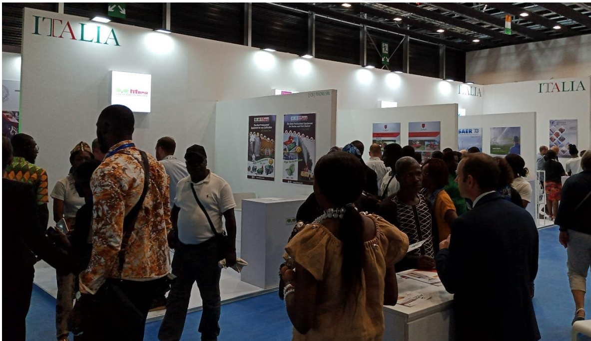
Pabellón Oficial de Italia