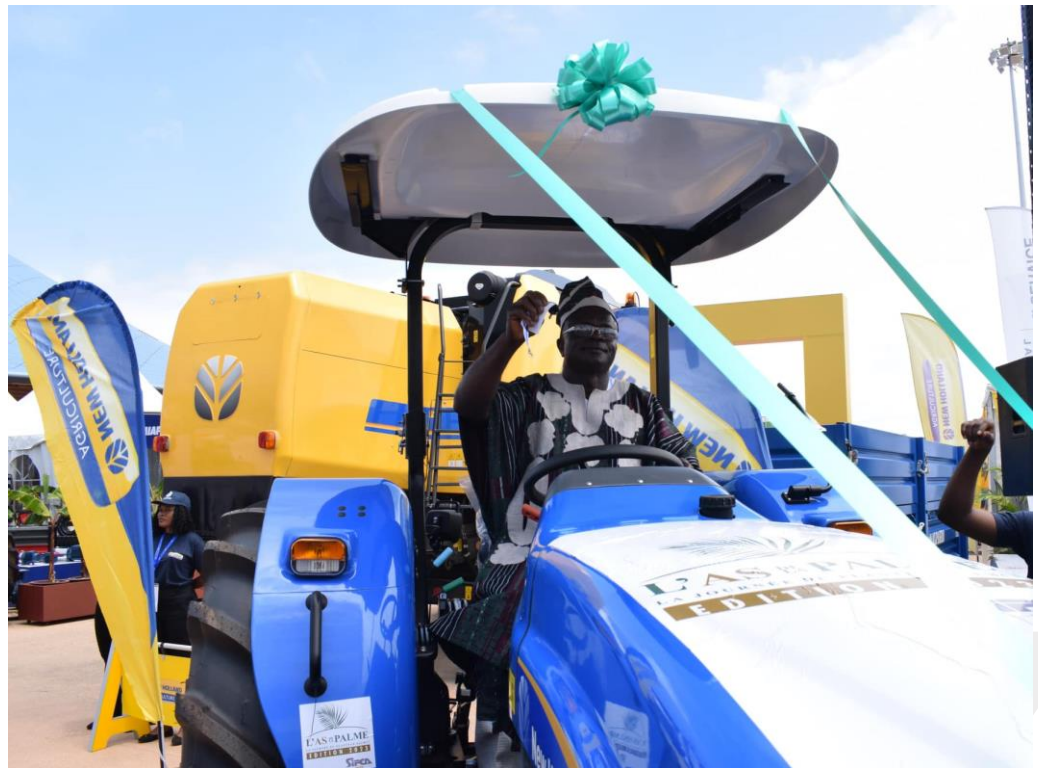
Zona de maquinaria.