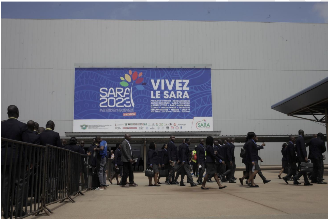
Publico accediendo a las instalaciones el día de la inauguración.

Desde la Oficina Económica y Comercial en Costa de Marfil, se organizó un servicio personalizado de agenda de reuniones para un productor de cítricos español para que viniesen durante las fechas de celebración del SARA y participasen como visitantes.