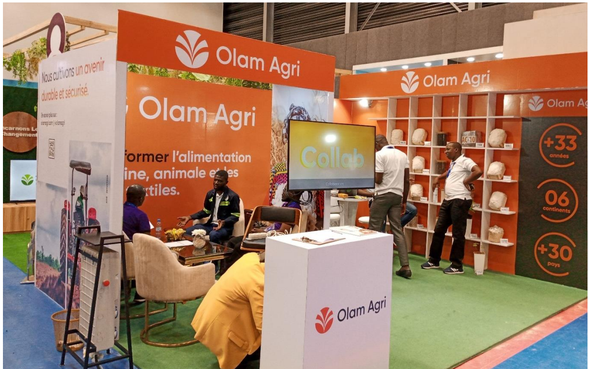
Interior del pabellón principal.