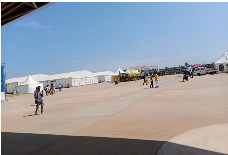
Carpas para eventos y conferencias.