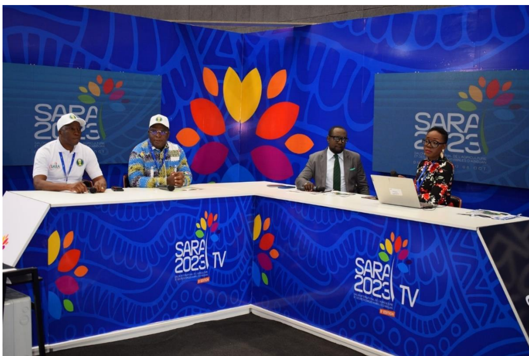
Imagen de uno de los talleres debate.

Durante toda la feria tuvieron lugar multitud de conferencias y eventos. Algunos de carácter público y otros privados. La lista completa de conferencias y talleres se puede consultar aquí . Las conferencias seguían el tema central de la feria: “La agricultura africana frente a los desafíos de las crisis internas y externas: qué innovaciones estructurales para mejorar los sectores agrícolas y la soberanía”.