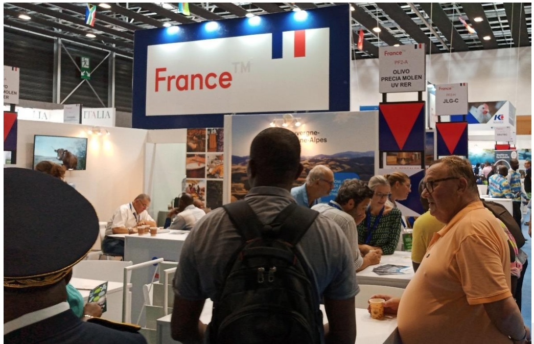
Pabellón Oficial de Francia.