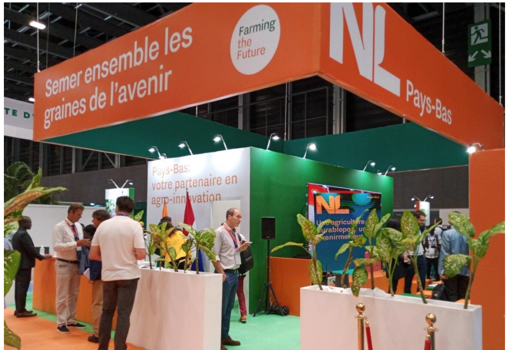
Pabellón Oficial de Países Bajos. Foto tomada por el personal de la oficina.