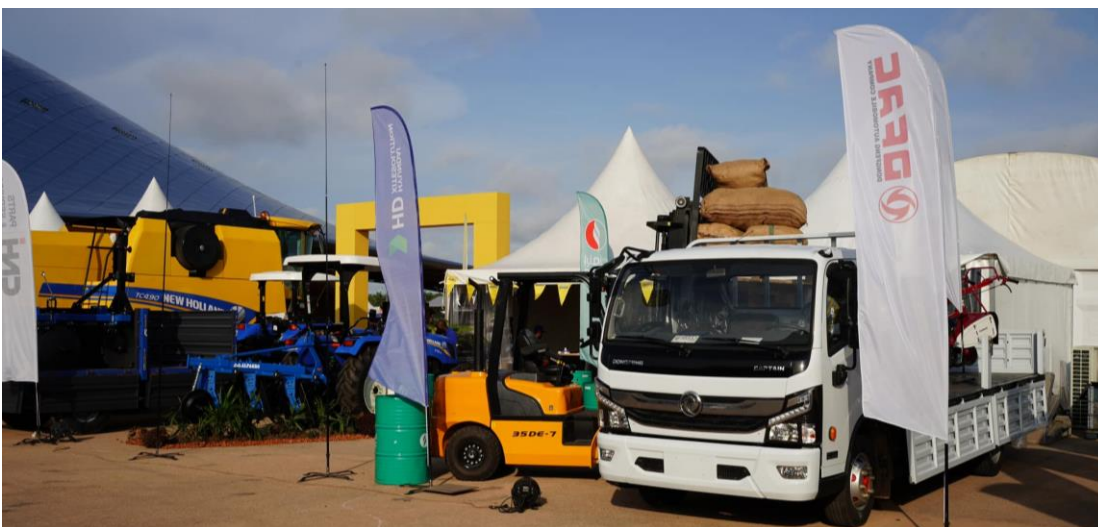
Zona de exposición de maquinaria.

La presencia de representación pública española en próximas ediciones puede permitir el dar una idea de la magnitud del mercado que se desarrolla para presentarlo a las empresas españolas que puedan estar interesadas.