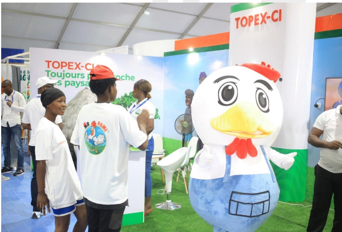
Interior del pabellón principal.