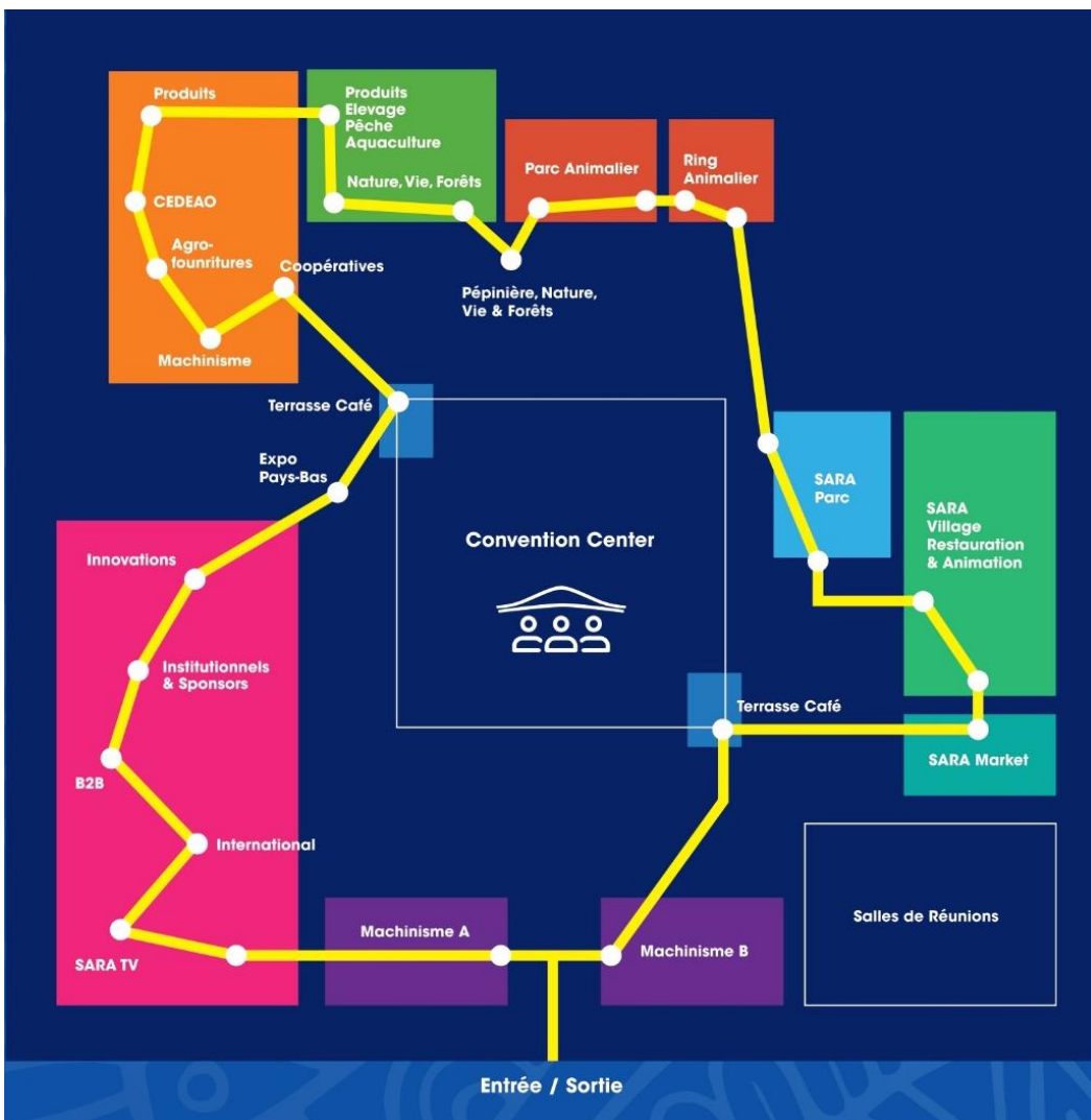
Fuente: página oficial SARA, 2023.