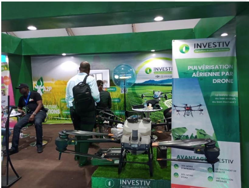
Uno de los stands con productos innovadores.

El mercado de fertilizantes también tiene oportunidades claras que están siendo explotadas, por ejemplo, por OCP Africa . Durante la feria se presentó el acuerdo de colaboración con el gobierno marfileño para la creación y puesta en marcha de 10 “ New Generation Agricultural Service Centers ” Tres de los cuales ya funcionan en Korhogo y han distribuido cerca de 2.000 toneladas de fertilizantes.