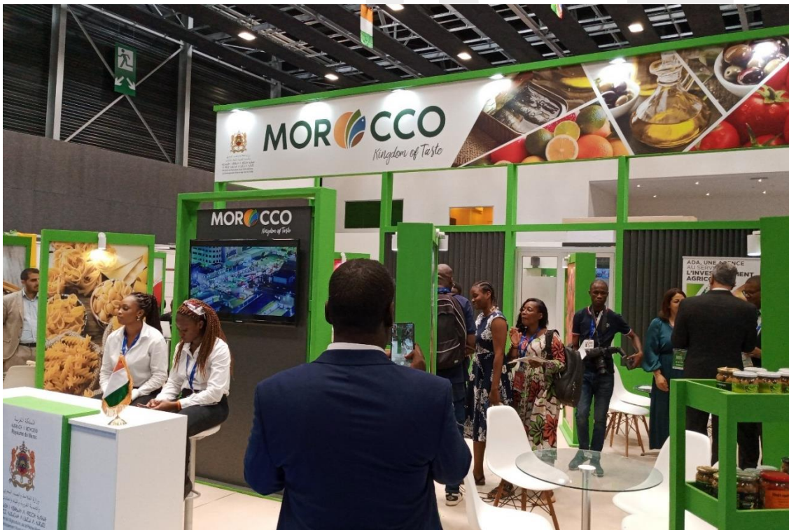
Pabellón Oficial de Marruecos.