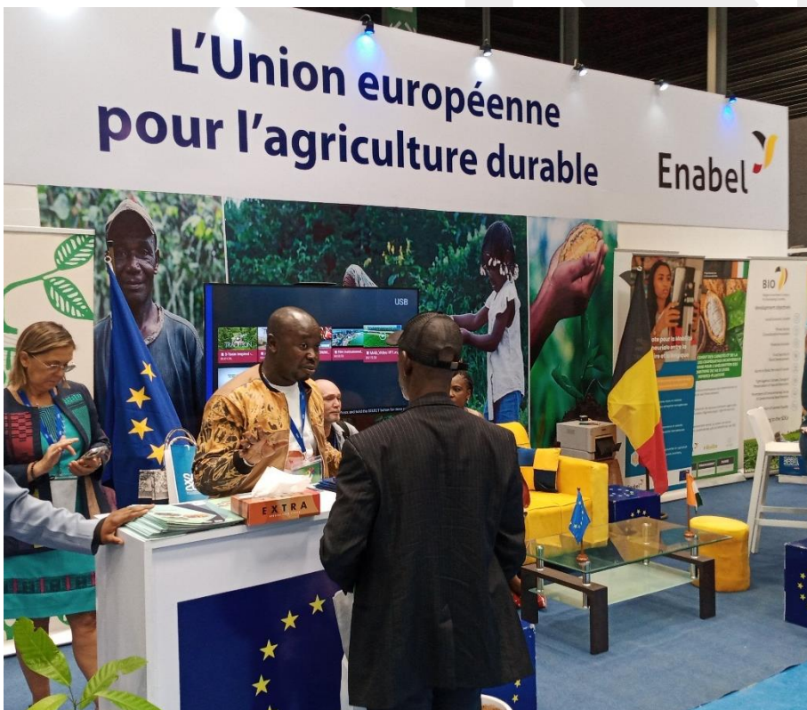
Pabellón Oficial de la Unión Europea.