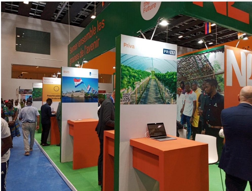
Pabellón Oficial de Países Bajos. Foto tomada por el personal de la oficina.