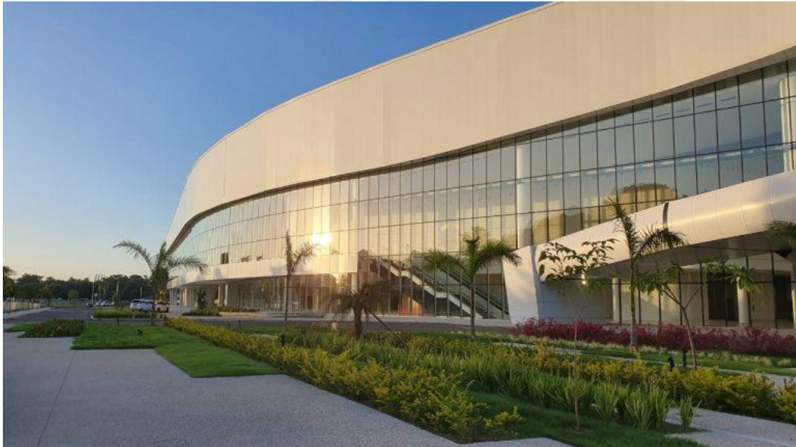
CENTRO DE CONVENCION DE AMADOR

Para solicitar información adicional, se puede rellenar el formulario que se encuentra en la web.