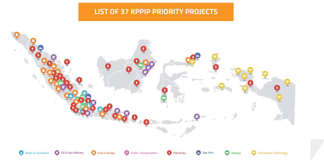
IMAGEN 1: PROYECTOS PRIORITARIOS KPIIP