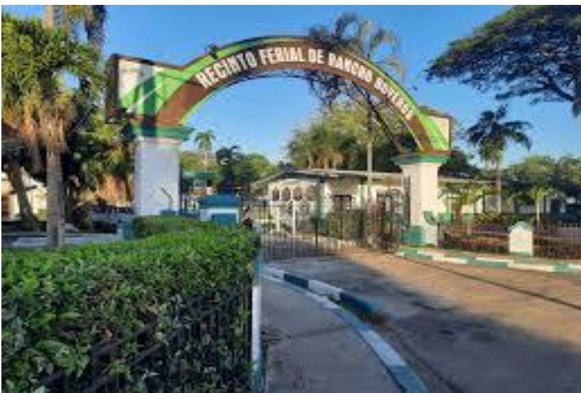
FOTO 1. ENTRADA AL RECINTO FERIAL