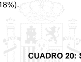
CUADRO 20: STOCK DE INVERSIONES DEL PAÍS EN ESPAÑA

ingeniería (46%), actividades auxiliares a servicios financieros (22%), y actividades inmobiliarias (18%).