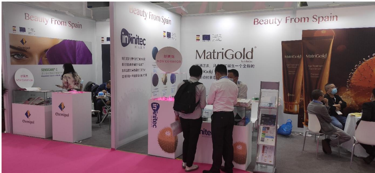
FPA PCHI 2021.

Los gastos personales derivados del viaje (vuelos, alojamiento, traslados, dietas, etc.) correrá a cargo de cada empresa participante. Stanpa les apoyará en la gestión del viaje y negociará tarifas especiales de alojamiento con los hoteles recomendados por la propia feria.