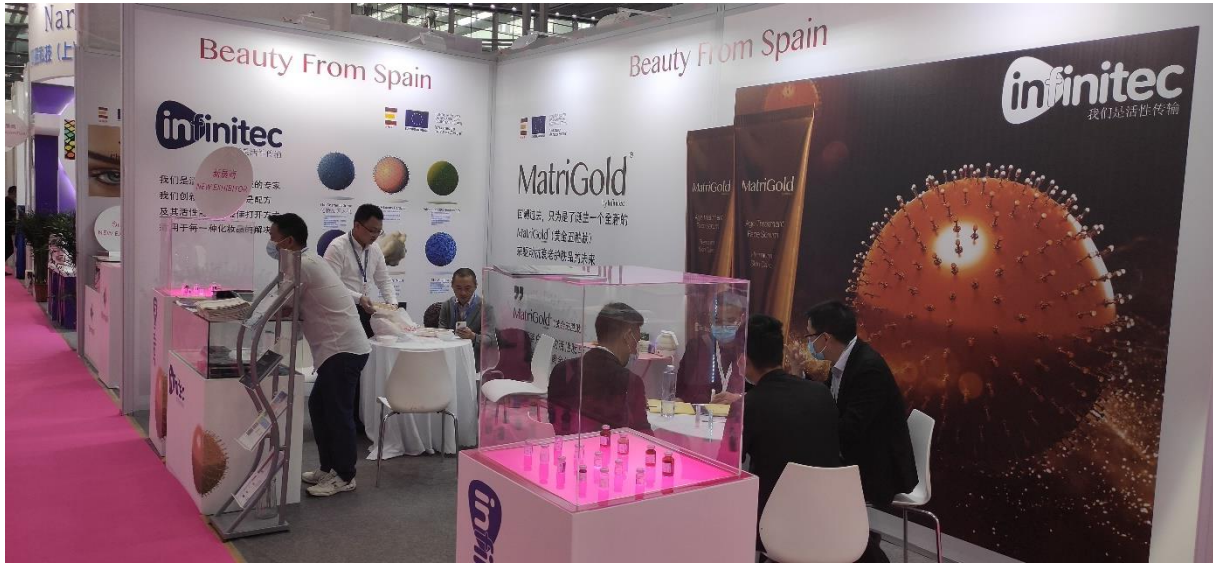
FPA PCHI 2021.