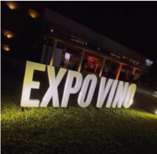
Entrada de EXPO VINO en Tayllerand Costanera.