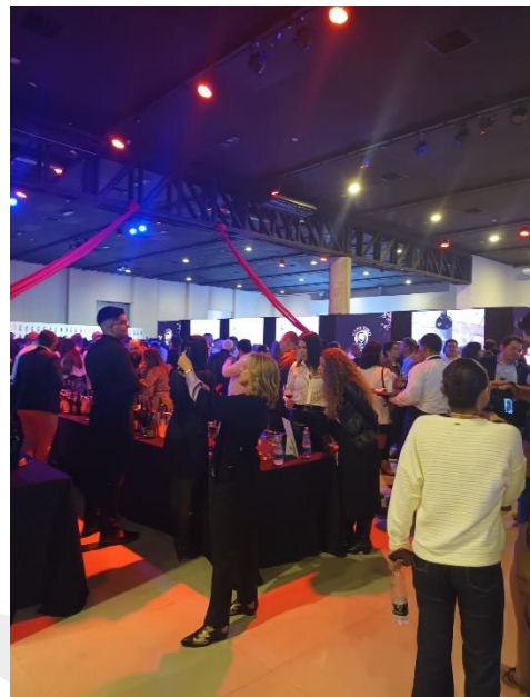
Pasillo central de EXPO VINO.