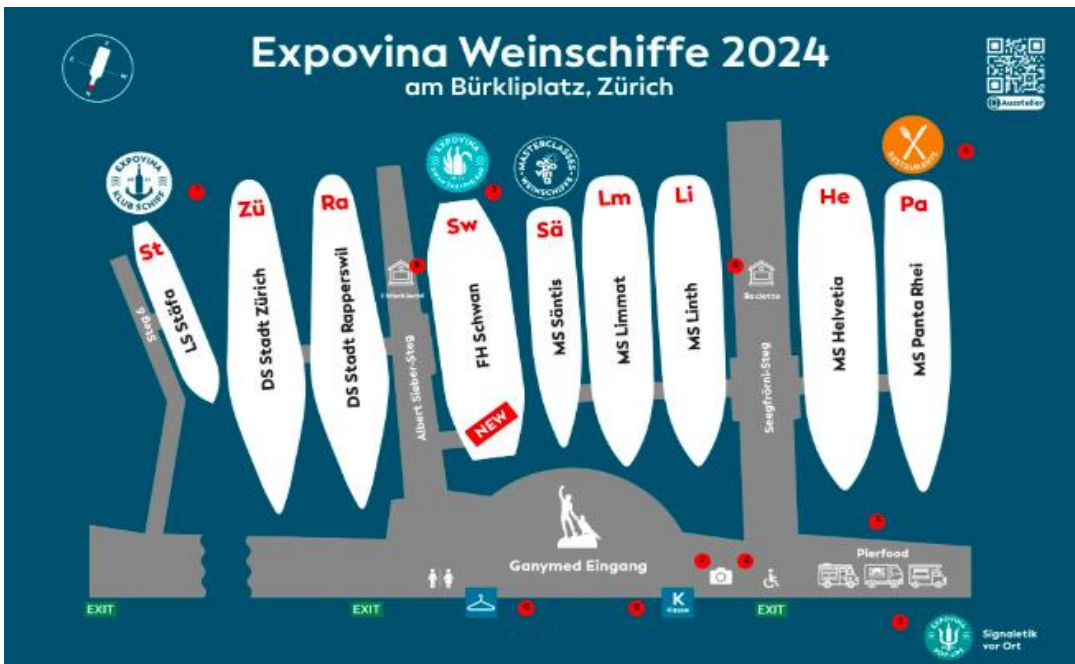
IMAGEN 2. MAPA DE LA FERIA

A continuación, en la Imagen 2 se muestra la distribución de los botes. Para más información sobre los expositores, véase el Anexo 4.4 de este mismo informe de feria.