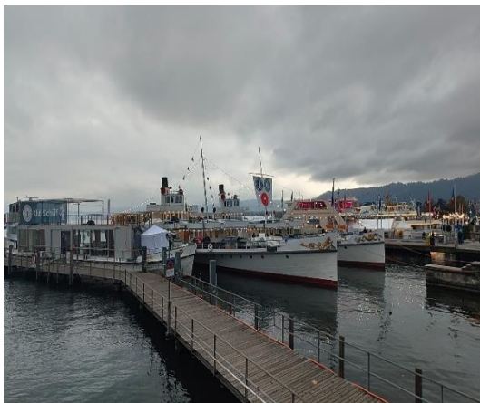
IMAGEN 1. FLOTA DEL LAGO DE ZURICH

Como en las ediciones anteriores, la feria tuvo lugar en Flota del Lago de Zúrich en Bürkliplatz, Bürkiplatz, Tram, 8001 Zúrich, Suiza.