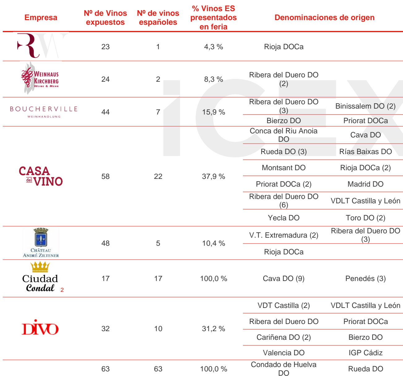
TABLA 1. EMPRESAS PARTICIPANTES CON OFERTA DE VINOS ESPAÑOLES

de los más de 3.700 vinos presentes en el catálogo oficial de la feria, más de 440 han sido españoles, situándose alrededor del 12 % del total. A continuación, en la tabla se muestran todos aquellos expositores que presentaron vinos españoles. Se especifica en la tabla, las denominaciones de origen de los vinos españoles, así como el porcentaje de vinos españoles presentados en la feria por el correspondiente expositor.