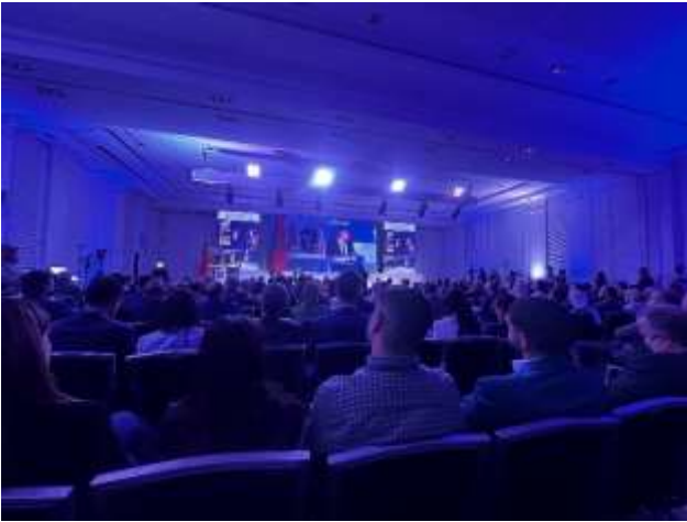
Inauguración oficial de la feria.