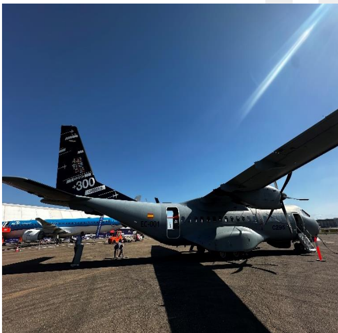
Único avión español.