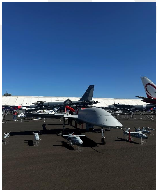
Único drone de la feria (Turquía).