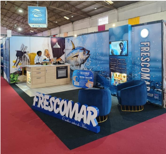
Imagen del stand de Frescomar en la XXVIIª edición de FIC.

Igualmente, algunas empresas españolas tuvieron representación a través de socios y clientes caboverdianos o portugueses.