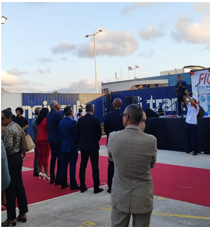
Imagen del acto de inauguración de la XXVII edición de FIC.

FIC incluyó también varias actividades paralelas como conferencias o desayunos empresariales en los días de la feria y en los anteriores, además de ceremonias de inauguración y clausura presididas por el Ministro del Mar y de las Comunidades y por el Primer Ministro, respectivamente.