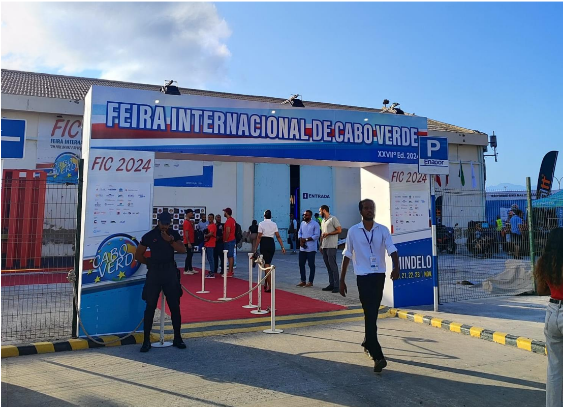
Entrada a la XXVIIª edición de la FIC