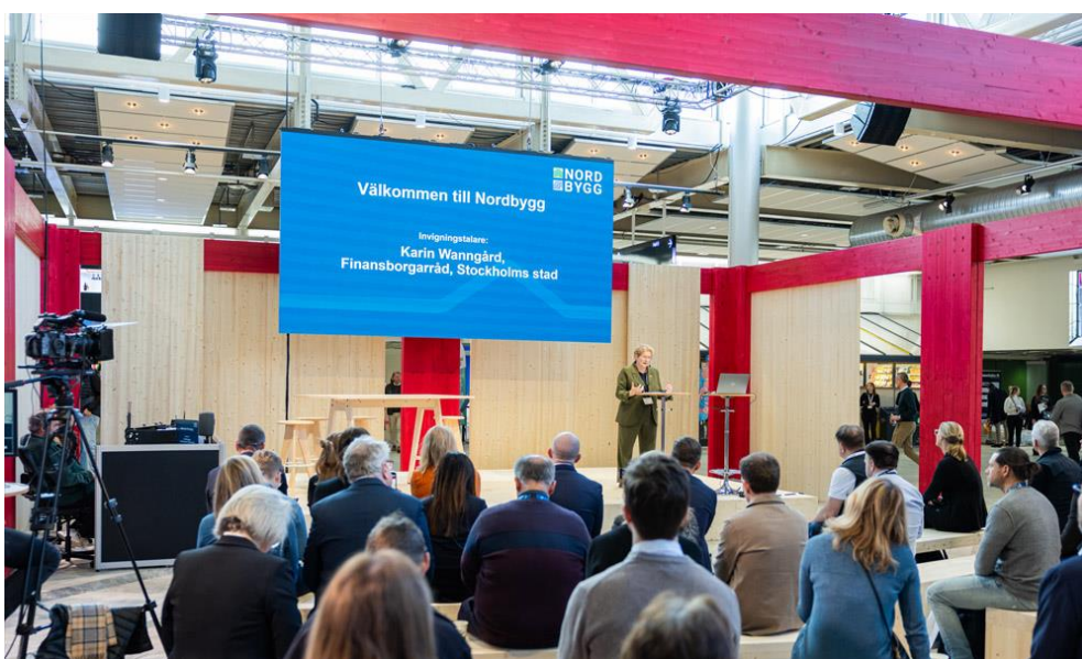
FOTOGRAFÍA 1. CONFERENCIA REALIZADA EN EL EVENTO