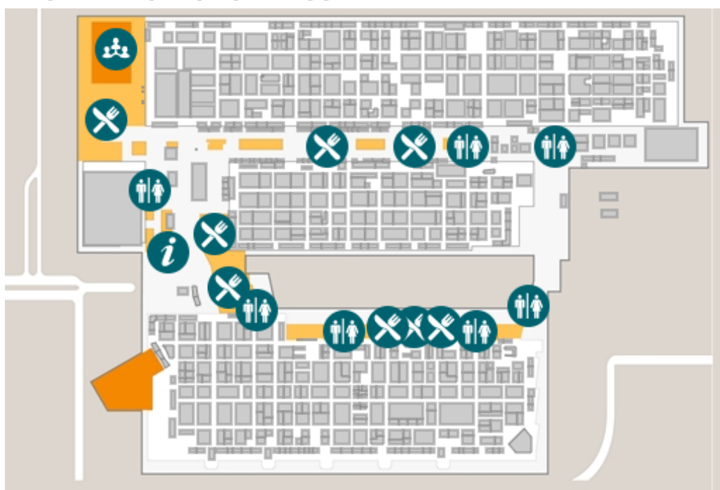
IMAGEN 1. RECINTO NORDBYGG

Mapa del recinto ferial Stockholmsmässan donde se ha celebrado NORDBYGG .