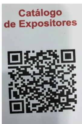
FIGURA 3: CÓDIGO QR CON LOS EXPOSITORES ESPAÑOLES DE LA FIHAV.

Este año, la AEEC desarrolló un sistema QR para facilitar el acceso al listado de empresas españolas y su ubicación en el recinto ferial. Se entregaron tarjetas con este código, que permitían descargar información a través de su propia página web.