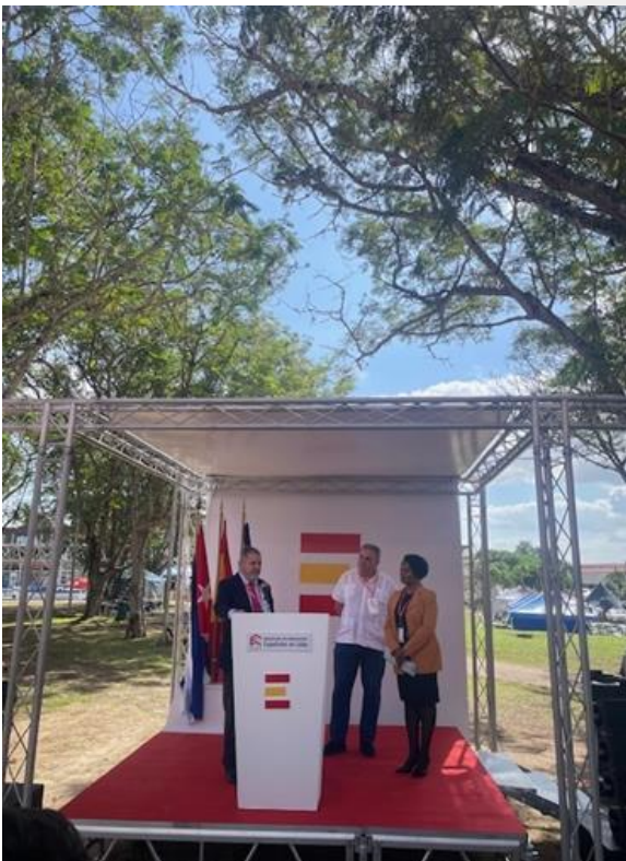
FIGURA 5. DISCURSO INAUGURAL DEL PABELLÓN ESPAÑOL POR PARTE DEL EXMO. SR. JAVIER HERGUETA GARNICA, EMBAJADOR DE ESPAÑA EN CUBA.