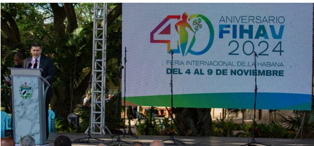
Figura 1: DISCURSO DE INAUGURACIÓN ÓSCAR PÉREZ-OLIVA FRAGA, MINISTRO DEL COMERCIO EXTERIOR Y LA INVERSIÓN EXTRANJERA.

Este año, el encargado de inaugurar la Feria fue el Ministro del Comercio Exterior y la Inversión Extranjera, Óscar Pérez-Oliva. El Presidente de la República visitó la Feria en su día inaugural.