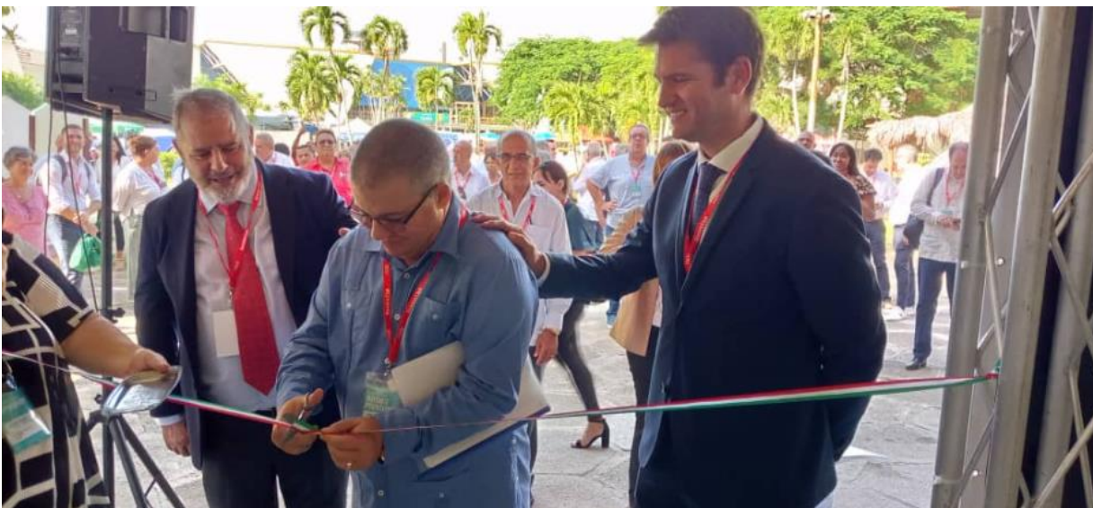
FIGURA 7: CORTE CEREMONIAL DE LA CINTA DE INAUGURACIÓN DEL PABELLÓN VASCO.