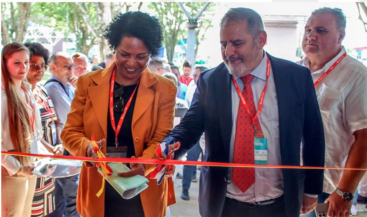
FIGURA 6. CORTE CEREMONIAL DE LA CINTA DE INAUGURACIÓN DEL PABELLÓN ESPAÑOL.

Después de los himnos cubano y español, se procedió a los discursos del Embajador, la Ministra Presidenta del Banco Central de Cuba y el presidente de la AEEC, quienes agradecieron la numerosa presencia empresarial de España en la Feria y destacaron la importancia de las relaciones entre ambos países. Tras ello, se procedió al ceremonial corte de la cinta a las puertas del pabellón, quedando así inaugurado este, y se realizó el recorrido oficial visitando a los expositores españoles presentes en él.