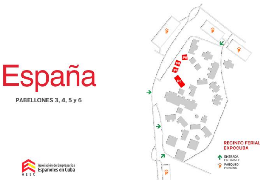
FIGURA 2. PLANO DEL RECINTO EXPOCUBA REMARCANDO LOS PABELLONES OFICIALES DE ESPAÑA DURANTE LA FIHAV 2024.