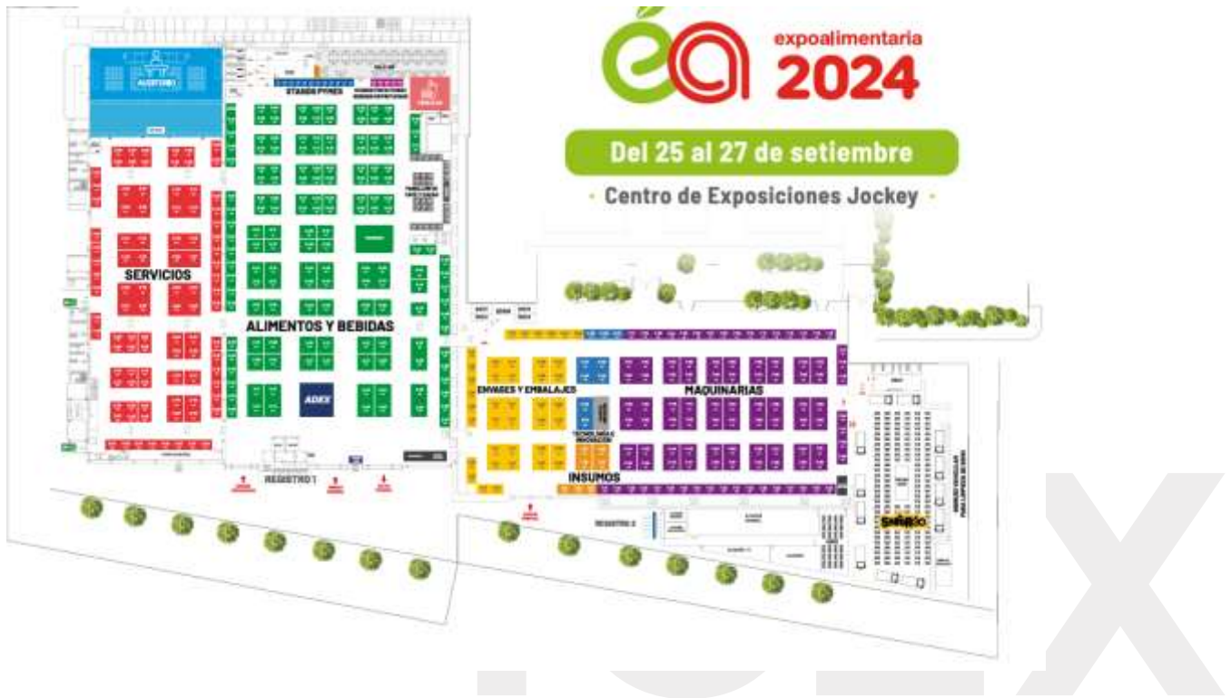
IMAGEN 1: DISTRIBUCIÓN PABELLONES EXPOALIMENTARIA 2024