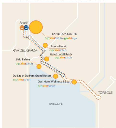
IMAGEN 1. PLANO DEL RECINTO

La estación de tren más cercana es la de Rovereto. Desde ahí existe un autobús interurbano que une Rovereto con Riva del Garda en 45-60 minutos de viaje. Para más información: www.ferroviedellostato.it