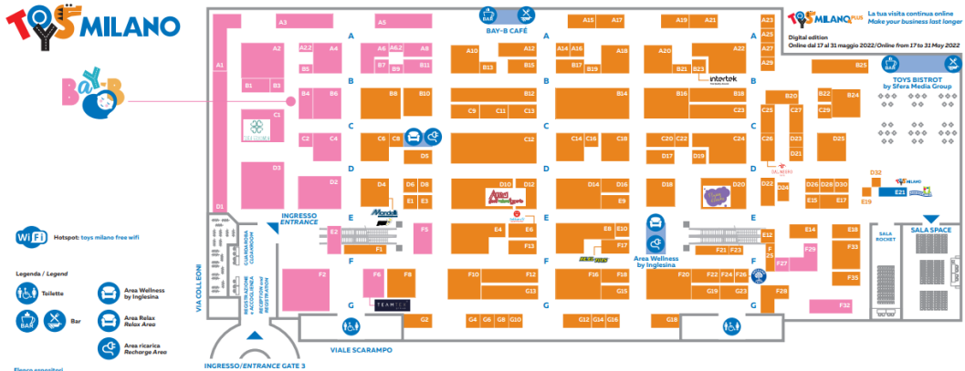
IMAGEN 1. PLANO DEL RECINTO