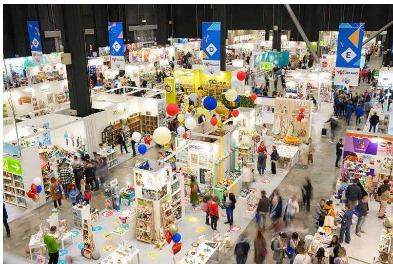
IMAGEN 2. VISITANTES EN LA FERIA