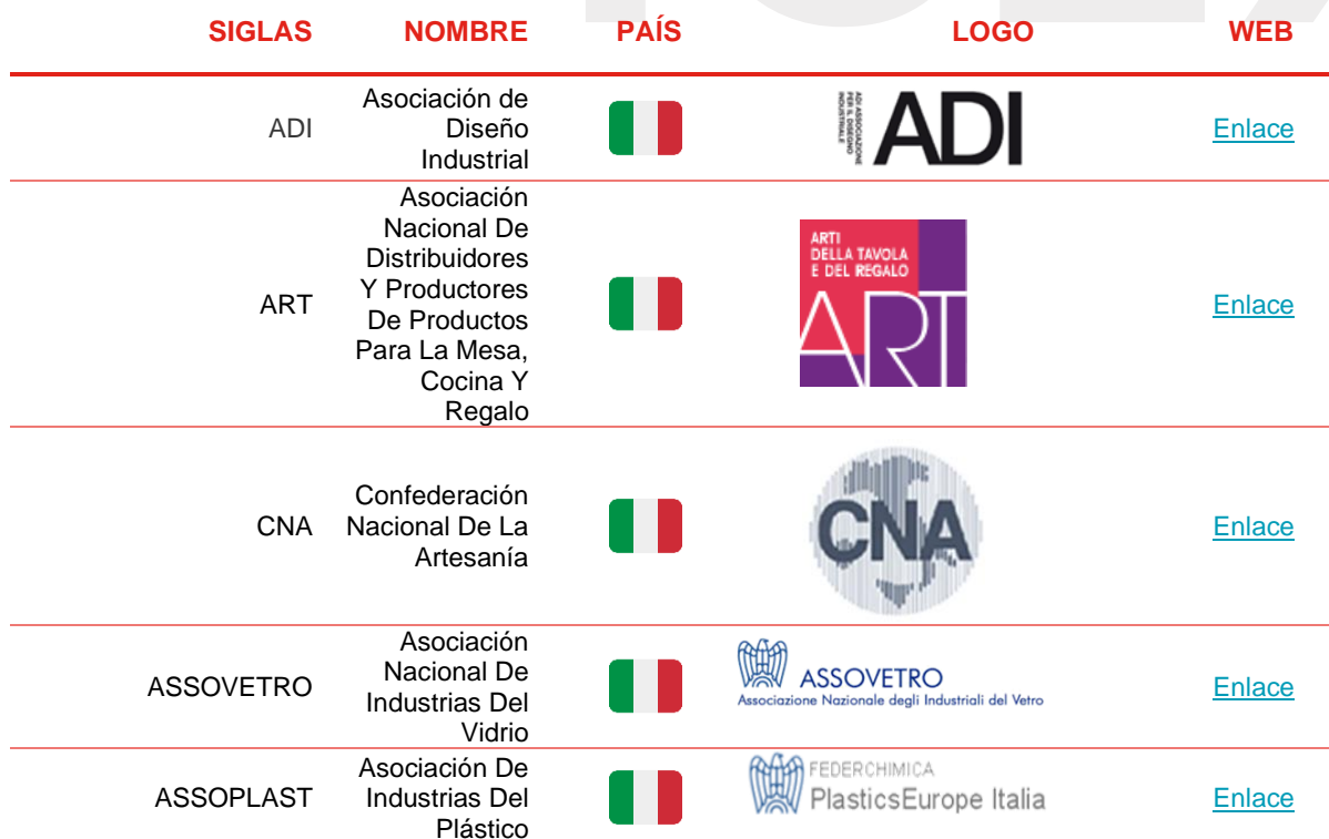
TABLA 6. ASOCIACIONES DEL SECTOR

El presente apartado recoge las Asociaciones que pueden interesar a las empresas españolas para entrar en el mercado italiano: