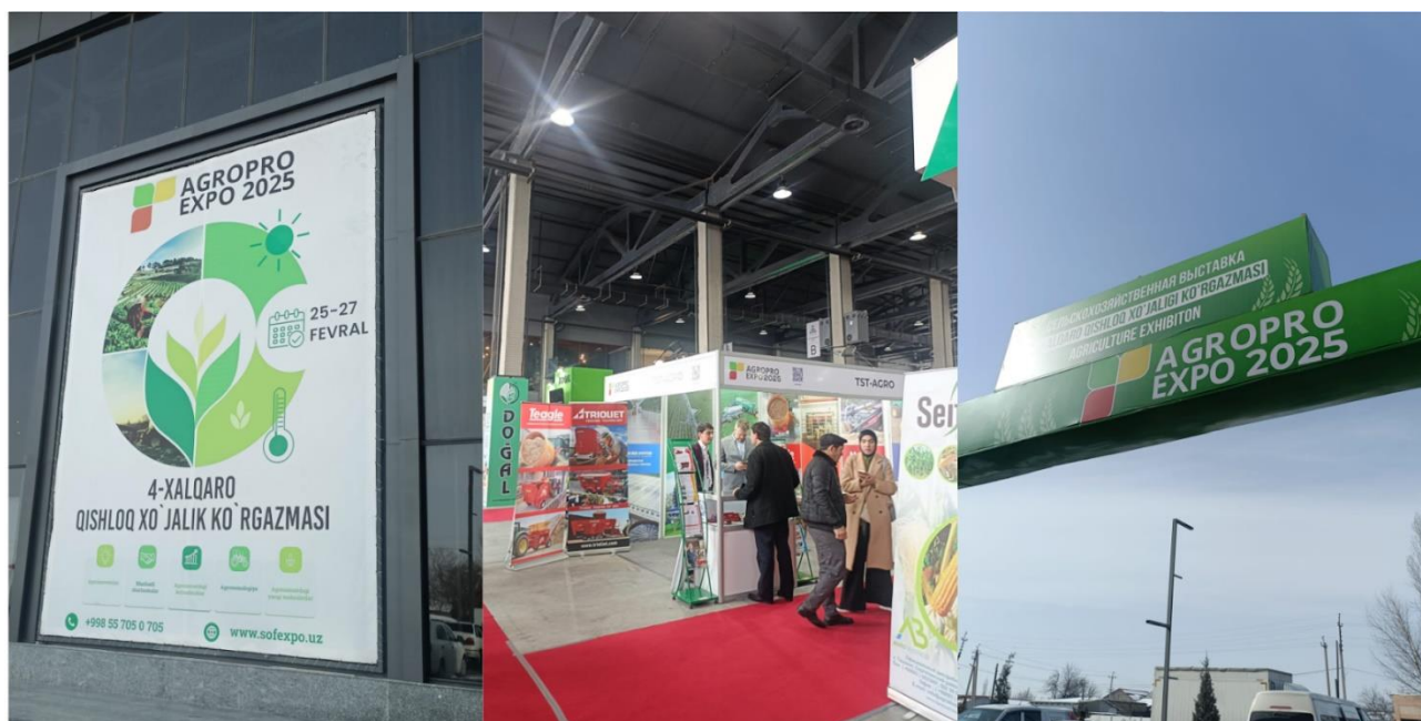
Publicidad exterior, stand estándar y entrada exterior a la feria.

Como se ha mencionado anteriormente, en la feria había presentes tres pabellones oficiales de Turquía, Irán y China. Desde la organización, se informó de la presencia en pasadas ediciones de pabellones de Kazajistán y Rusia. En cada pabellón, se encontraban entre 10 a 15 empresas, algunas presentes solamente determinados días de la feria.