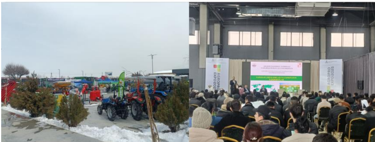
Patio exterior del feria y escenario principal.