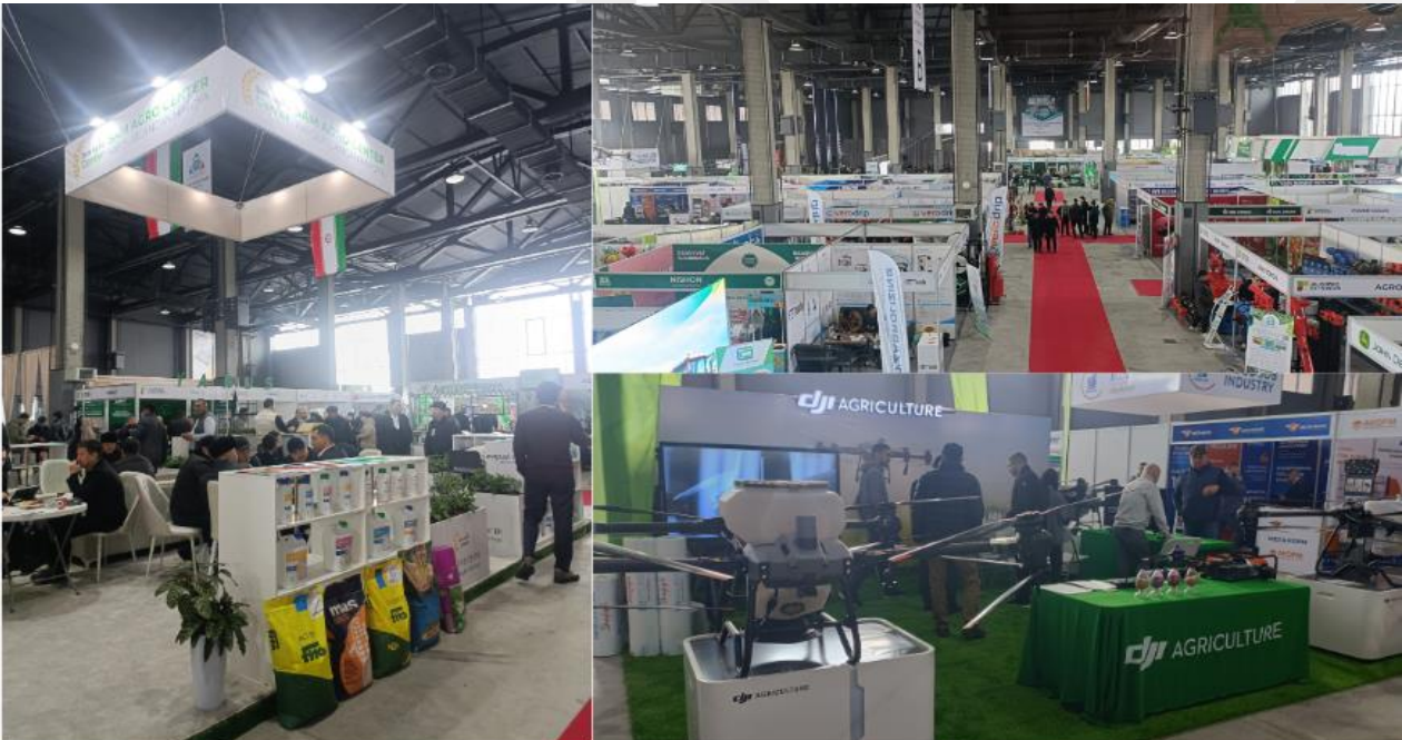
Stand de Irán, distribución de la feria y stand de la empresa china DJI.