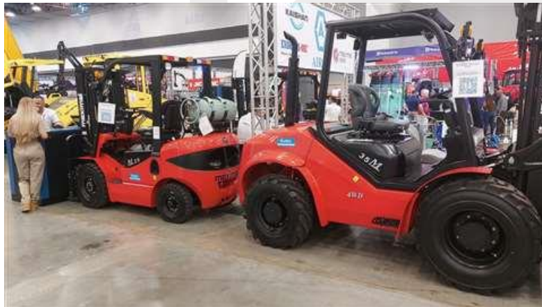
Maximal M25 expuestas por AIRCO