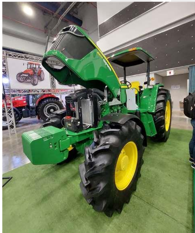
John Deere 6603 de Copanama