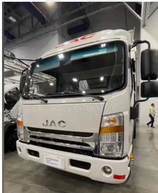
Volquete HFC 3070 de Jac Motors Panamá