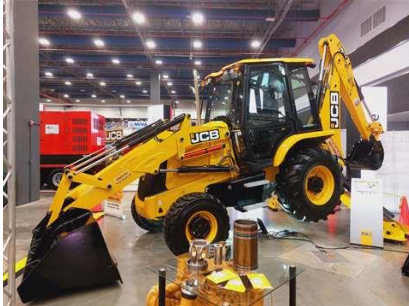
Retroexcavadora JCB 3CX de Cardoze & Lindo