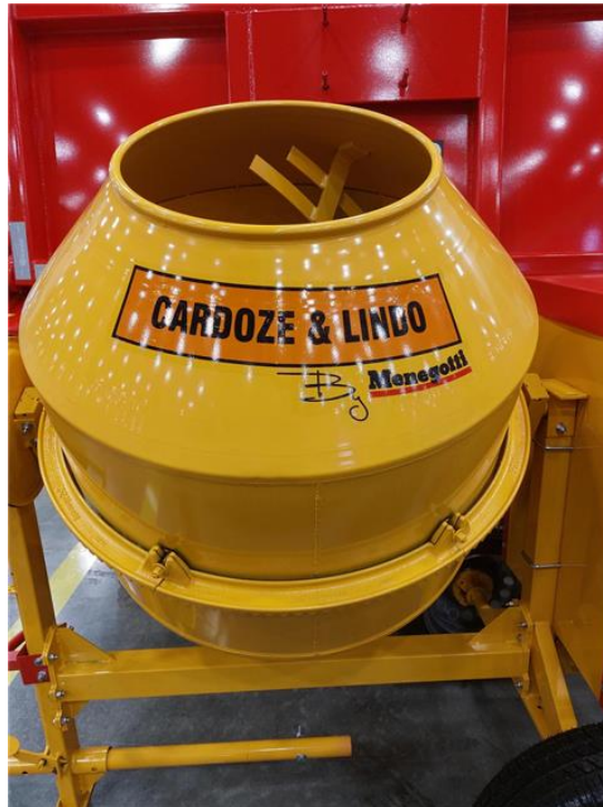
Hormigoneras presentadas por Grupo Menegotti