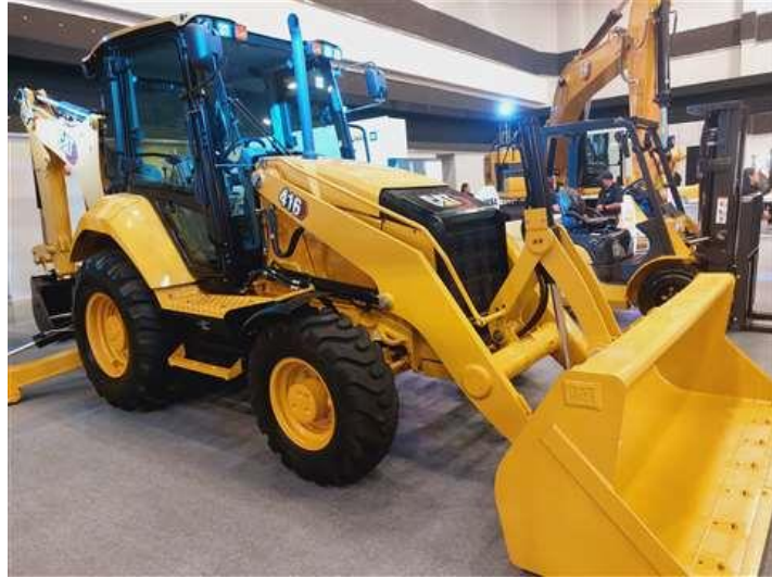
Retroexcavadora CAT 416 expuesta por IASA