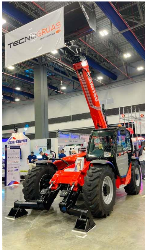
MTX 1740 de Tecno Grúas