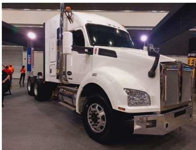
T880 6x4 de Kenworth