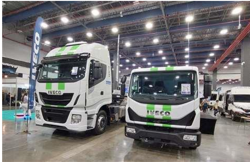
Camiones medianos y semipesados de Iveco Panamá