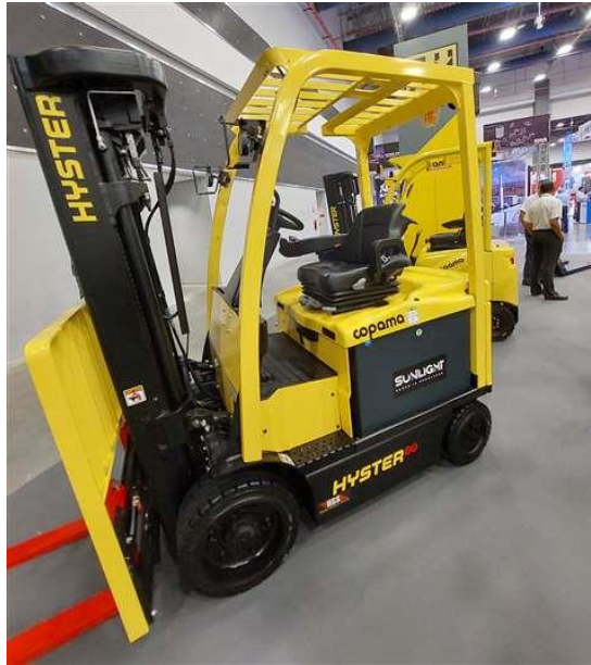
Carretilla elevadora H40 – 60 XT de Copama.