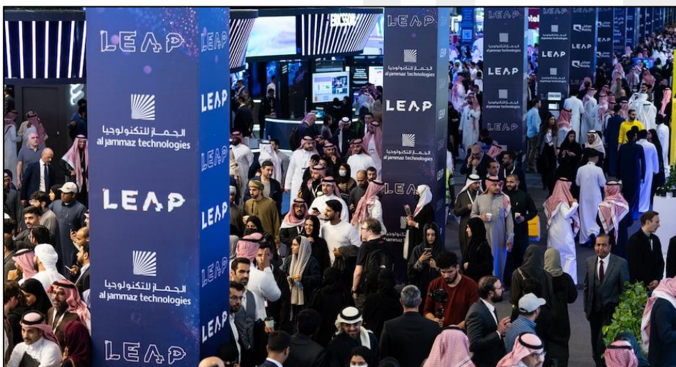
FOTO DE LA FERIA