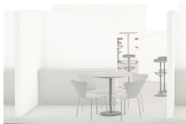
Imagen orientativa de puesto de trabajo con caja de luz, mesas y sillas, almacenaje bajo y zona de paso.

Serán bienvenidas ideas innovadoras que mejoren la apariencia del puesto de trabajo.