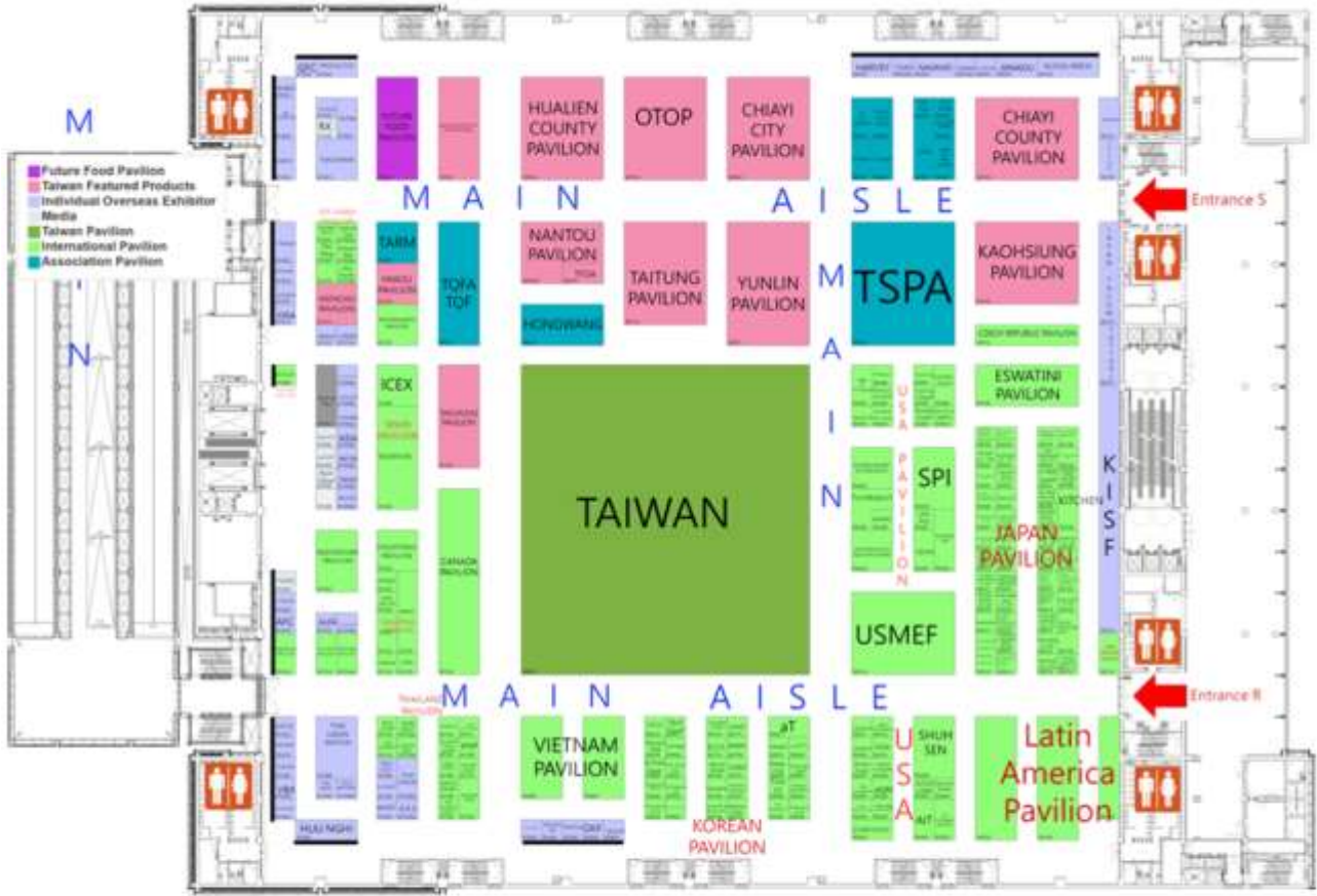
台北南港展覽館2館 Taipei Nangang Exhibition Center, Hall 2 四樓平面圖 4th Floor Plan