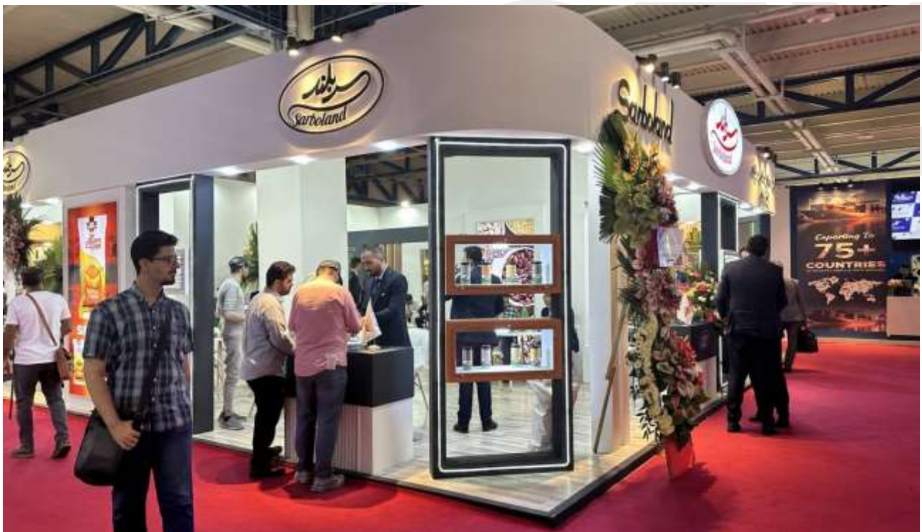
Ilustración 1. Interior de IranAgrofood 2024.

La 31.ª edición de IranAgrofood, organizada por la empresa alemana Fairtrade Messe y sus socios iraníes Palar Samaneh, se llevó a cabo en Teherán desde el 8 al 11 de junio de 2024. Un total de 847 expositores de 12 países diferentes han participado en el evento. Como era de esperar, la mayoría de los expositores eran iraníes; 715. En lo que respecta a las empresas extranjeras, han participado 136, desde los siguientes países: Austria, China, Dinamarca, Alemania, India, Italia, Rusia, Mongolia, España, Países Bajos, Tailandia, Turquía, Omán y Emiratos Árabes Unidos.