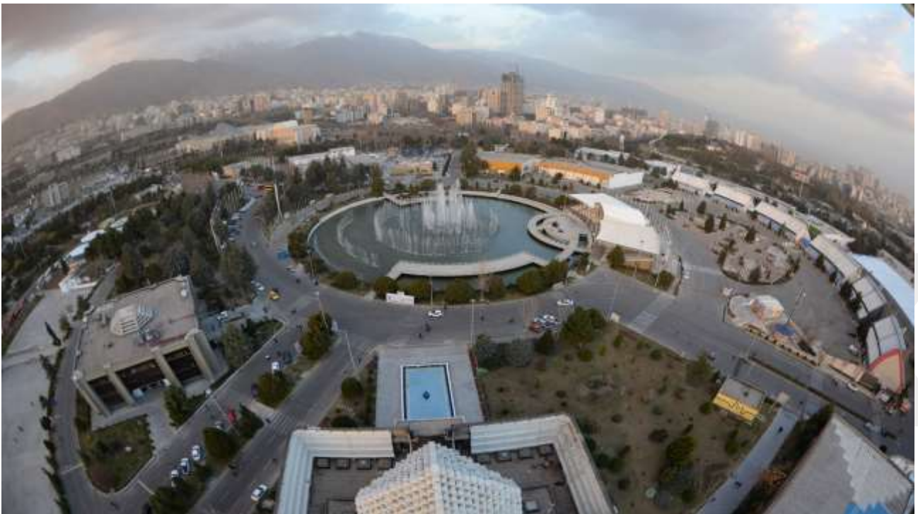
Ilustración 4. Tehran International Exhibition Centre.

La feria IranAgrofood hace uso de la infraestructura del Tehran International Exhibition Centre, que cuenta con estacionamiento, servicios y seguridad. Además, también dispone de una gran oferta de restaurantes, principalmente fuera de los pabellones, también hay una zona reservada para conferencias, donde se suelen realizar las ceremonias de inauguración.