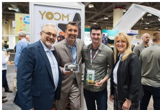
Yoom Tomatoes de Nature Fresh Farms