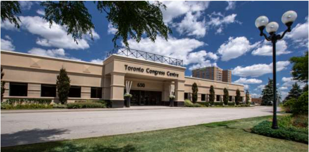
Imagen del Toronto Congress Centre en el que tuvo lugar el evento.

A continuación, se puede ver el plano detallado de la organización de la feria en la que se distribuyeron un total de 92 booths de distintos tamaños. Al no haber un pabellón oficial español, las marcas de nuestro país estaban distribuidas por todo el recinto en las distintas localizaciones de sus distribuidores.