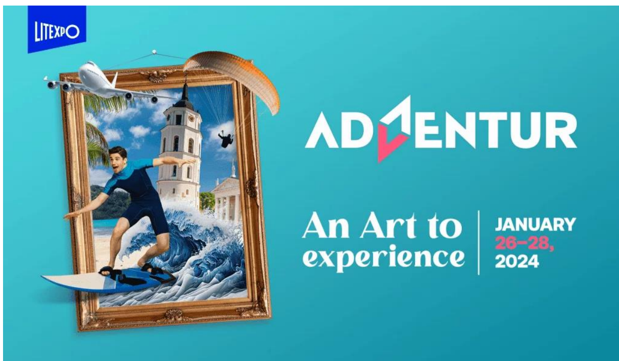
TABLA 1. DATOS GENERALES DE ADVENTUR 2024

International tourism, travel and active leisure exhibition