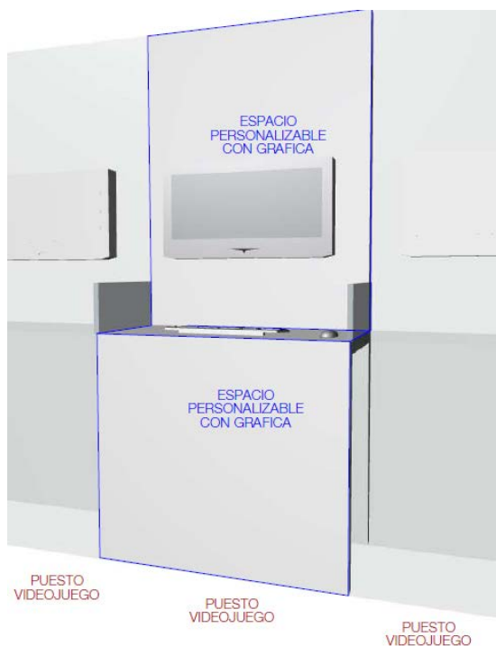
Puesto Indie (imagen orientativa)