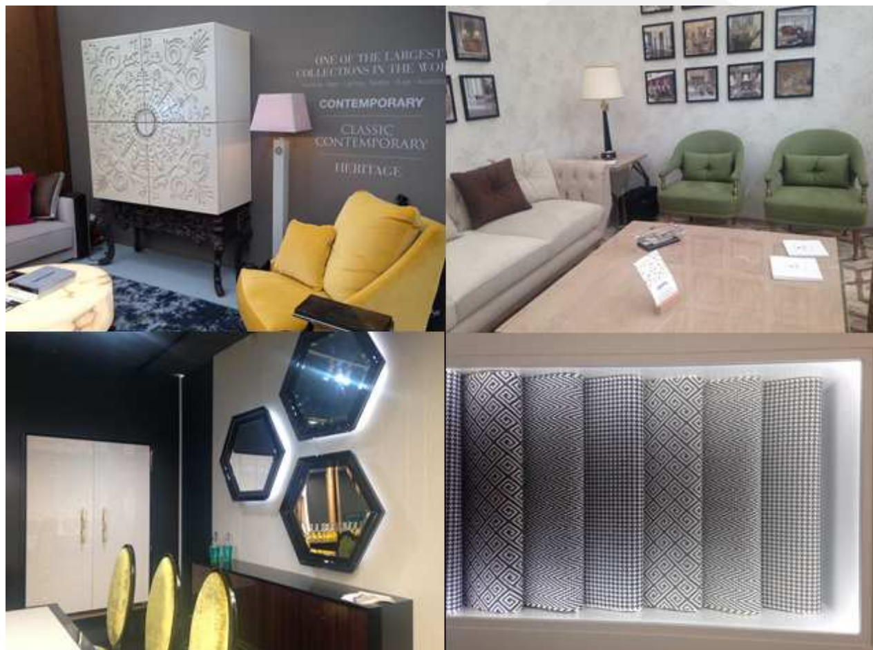
Imagen 1. De arriba a abajo y de izquierda a derecha, Colección Alexandra, Soher, La Ebanistería y Moquetas Rols.