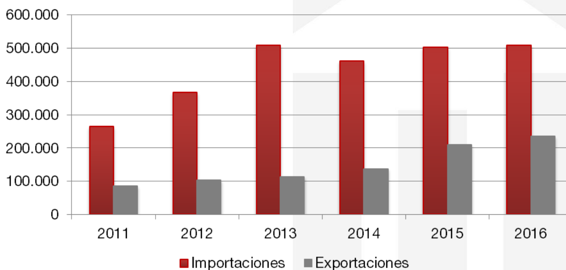
Importaciones y exportaciones partidas 230800, 230910 y 230990 (miles USD)

Por otro lado, Vietnam se muestra con potencial exportador . En los últimos 5 años, la cifra de exportaciones se ha duplicado superando en 2016 los 200 millones de dólares, destinados a mercados como Camboya e India.