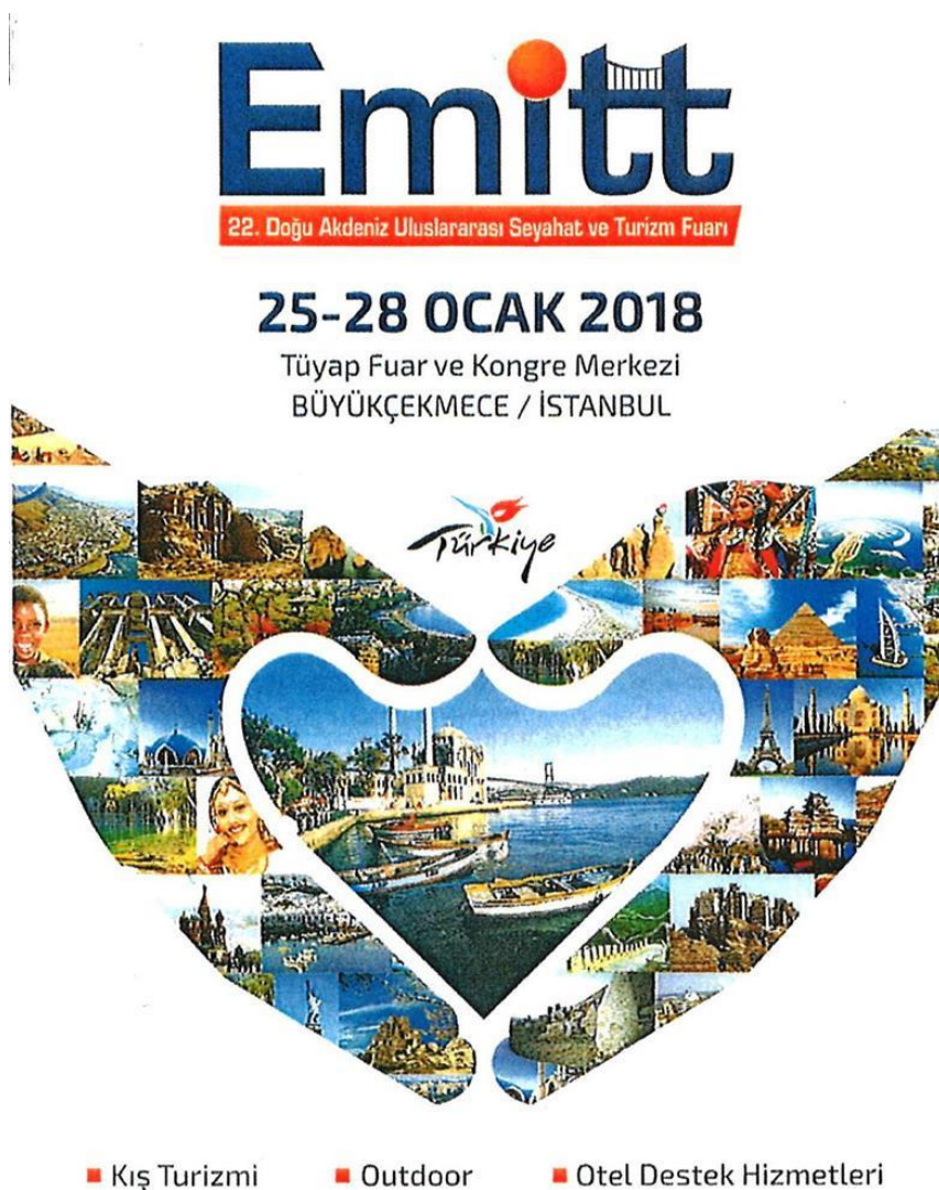
ILUSTRACIÓN 2. IMAGEN DE EMITT 2018

Los países con mayor representación en esta Emitt han sido Irán, Grecia, Filipinas, Egipto, Japón y las repúblicas Bálticas. Por el contrario, algunos de los países que han estado ausentes son España y Eslovenia -, aunque ya está confirmada para la próxima edición - y la participación de los países de Oriente Medio se ha visto bastante mermada debido a la inestabilidad de dichos territorios.