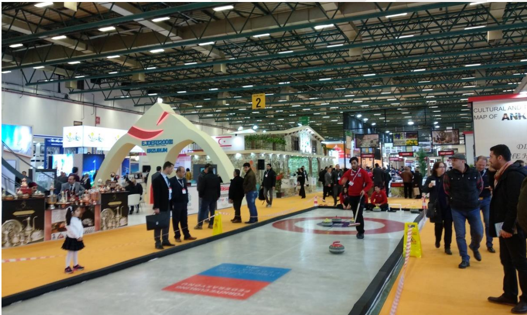
ILUSTRACIÓN 1. FOTOGRAFÍA DEL DESARROLLO DE EMITT 2018

En esta edición se han podido observar las diferentes tendencias que se están asentando en los principales mercados turísticos y en especial en el mercado turco. Tal y como han expresado los organizadores, el objetivo de la industria turística en Turquía es potenciar otros tipos de turismo alternativos al turismo de sol y playa como es el ecoturismo, el turismo rural o turismo gastronómico, sin alejarse del turismo costero que proporciona la mayoría de visitas a Turquía. Este objetivo se ha visto reflejado en la Emitt 2018, con un aumento considerable de los expositores relacionados con estos tipos de turismo alternativo. Algunos expositores han llevado como novedad, experiencias de realidad virtual para los visitantes.