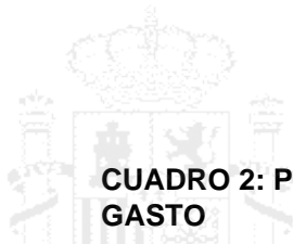
CUADRO 2: PIB POR SECTORES DE ACTIVIDAD Y POR COMPONENTES DEL GASTO