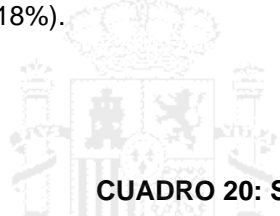
CUADRO 20: STOCK DE INVERSIONES DEL PAÍS EN ESPAÑA

ingeniería (46%), actividades auxiliares a servicios financieros (22%), y actividades inmobiliarias (18%).