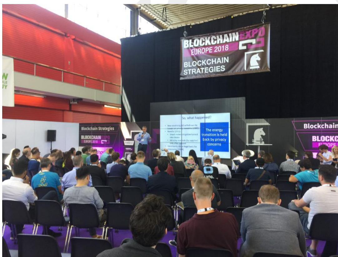
Ilustración 4: exponente durante la segunda jornada de Blockchain Expo Europe

Dado que gran parte de los asistentes a la feria son personas que trabajan en el sector financiero y tecnológico es especialmente interesante si opera en este sector.