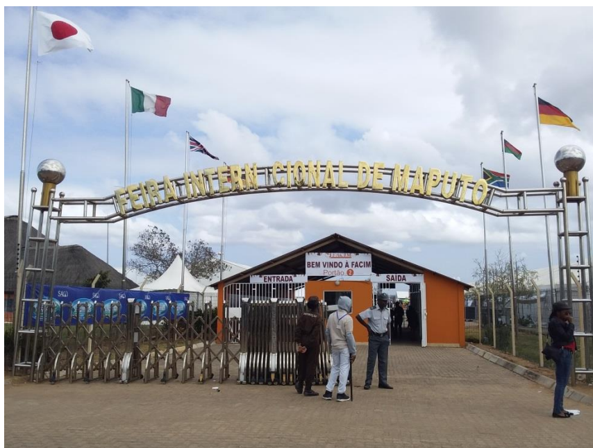
Una de las entradas principales al recinto ferial de la 54ª edición de Facim.

Desde un punto de vista comercial FACIM es una feria multisectorial, de carácter internacional. Puede considerarse como la única feria o exhibición de valor para la empresa española en Mozambique. Si bien en los últimos años han surgido en Mozambique varias ferias y conferencias sectoriales de mucha menor envergadura en sectores como la construcción, el turismo, la moda o la energía, se trata más bien de ferias minúsculas, aún en su infancia. Ante esta deficiencia, el empresario mozambiqueño asiste con asiduidad a las buenas ferias sectoriales que se celebran en la vecina Sudáfrica. Por el momento FACIM es la única feria de interés en Mozambique.