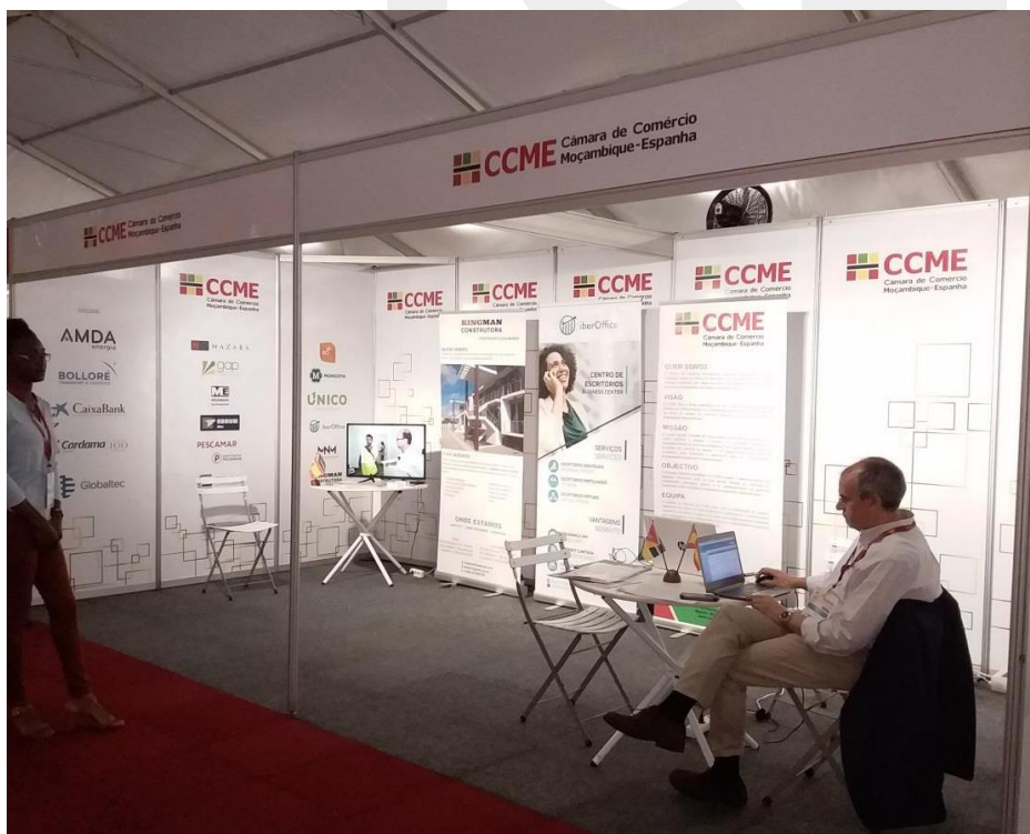
Stand de la Cámara de Comercio Mozambique – España en Facim 2018.

A continuación la fotografía del stand informativo de la Cámara de Comercio de España en Mozambique con los diferentes representantes de las empresas presentes: