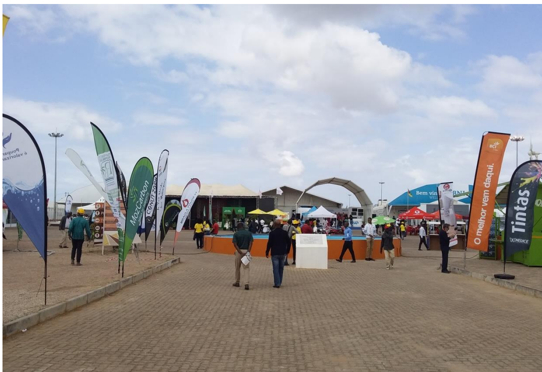
Vista de la parte exterior de la 54ª edición de Facim.

El éxito del expositor está ligado a varios factores, en particular, la calidad de decoración del pabellón o stand, para atraer a un mayor número de visitantes, la cantidad de contactos establecidos, el volumen de ventas concretadas, etc.