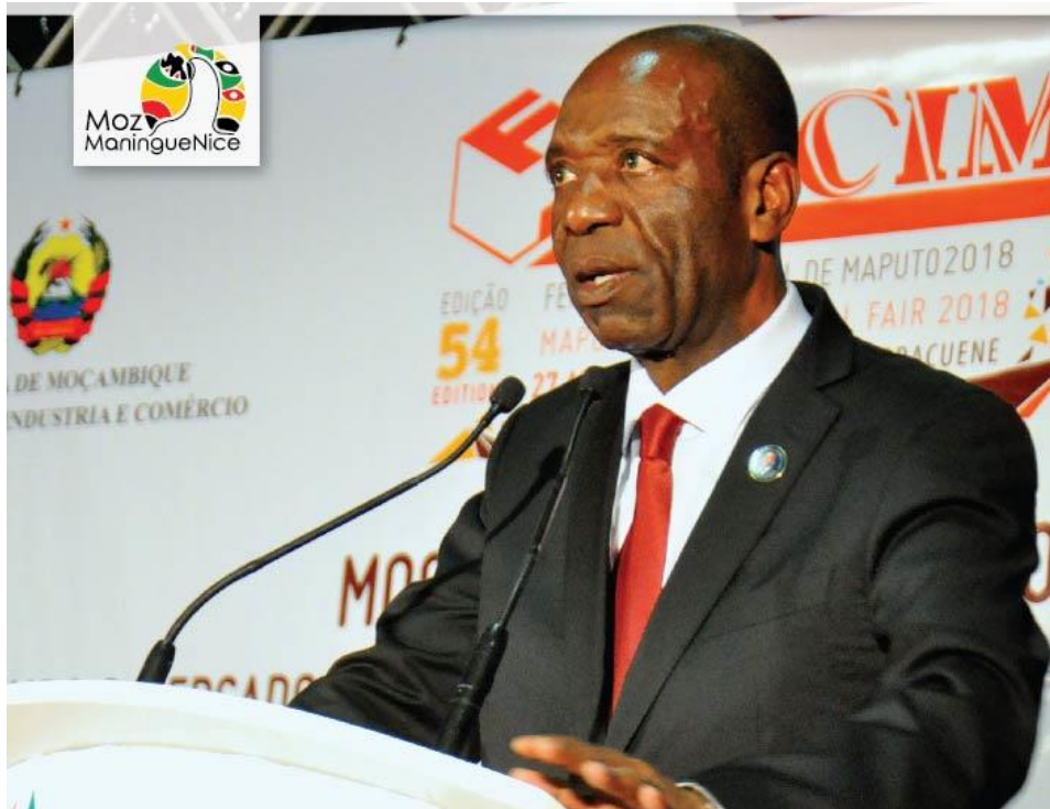
El Primer Ministro de la República de Mozambique, Carlos Agostinho do Rosário, el día de la inauguración de la feria.

De cara a las ediciones futuras de la feria, se prevé que éstas atraigan a más empresas e inversores extranjeros, impulsados principalmente por los descubrimientos de yacimientos de gas de los últimos años en la zona norte de Mozambique, los más importantes de las últimas décadas en el mundo.