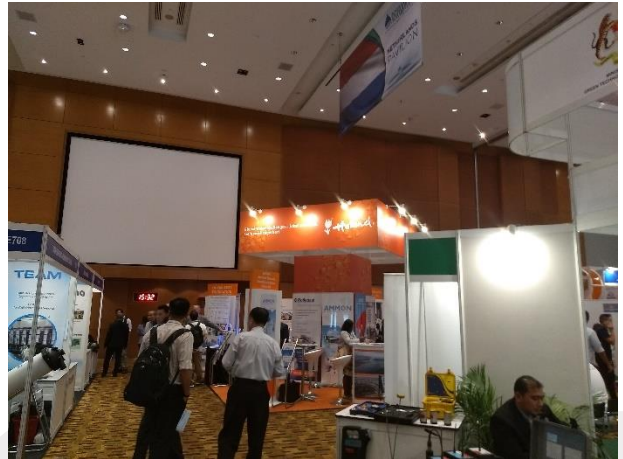
Foto 3. Pabellón de Singapur