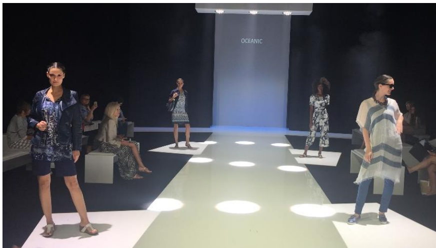
Foto realizada durante el evento