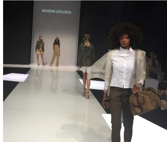
Foto realizada durante el evento