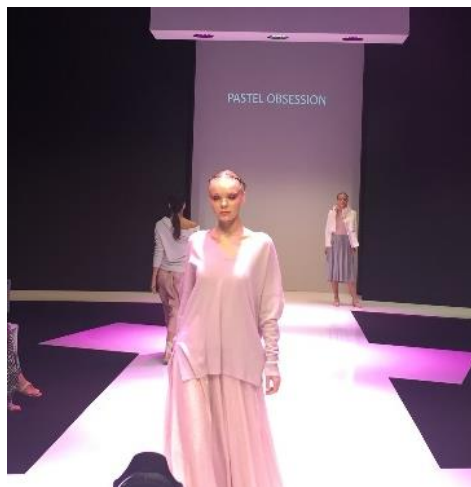
Foto realizada durante el evento