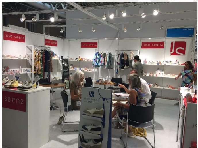
Foto realizada durante el evento

Footwear boutique: selección de calzado para mujer.