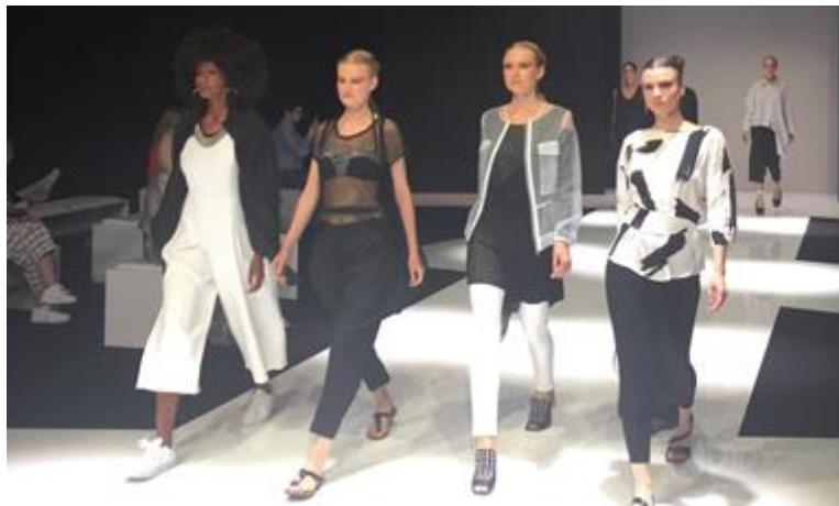
Foto realizada durante el evento