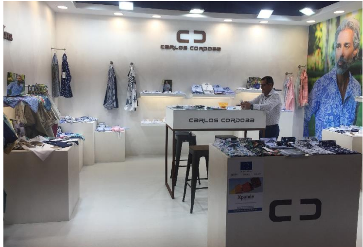
Stand de la empresa española Carlos Córdoba

En Moda UK se presenta una gran colección de ropa y accesorios para hombre, incluyendo ropa íntima, cinturones y bolsos. Moda Gent acoge más de 200 marcas cada temporada, que abarca desde marcas de moda casual hasta marcas que representan un estilo de vida más formal.