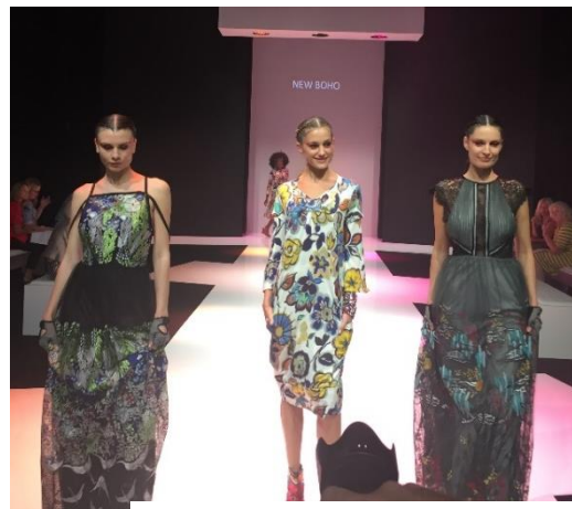
Foto realizada durante el evento