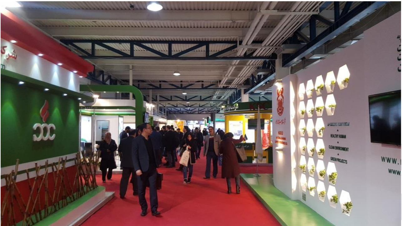
Ilustración 2. Imagen de la feria.