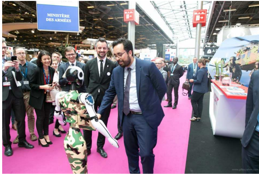
Visita de Mounir Mahjoubi, Secretario de Estado de Economía Digital, a Eurosatory

El sector de Seguridad y Defensa se caracteriza en la actualidad por la creciente importancia del componente tecnológico. A este respecto, la feria sirve de escaparate para que las empresas del sector den a conocer a la prensa internacional sus últimos equipos y novedades tecnológicas.