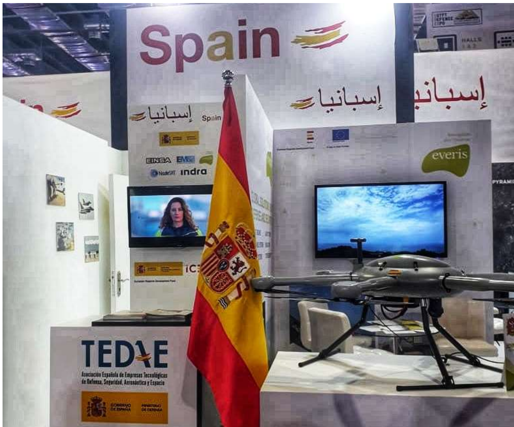
Pabellón Oficial ICEX

Además de los componentes del pabellón de España, las siguientes empresas participaron en la feria: