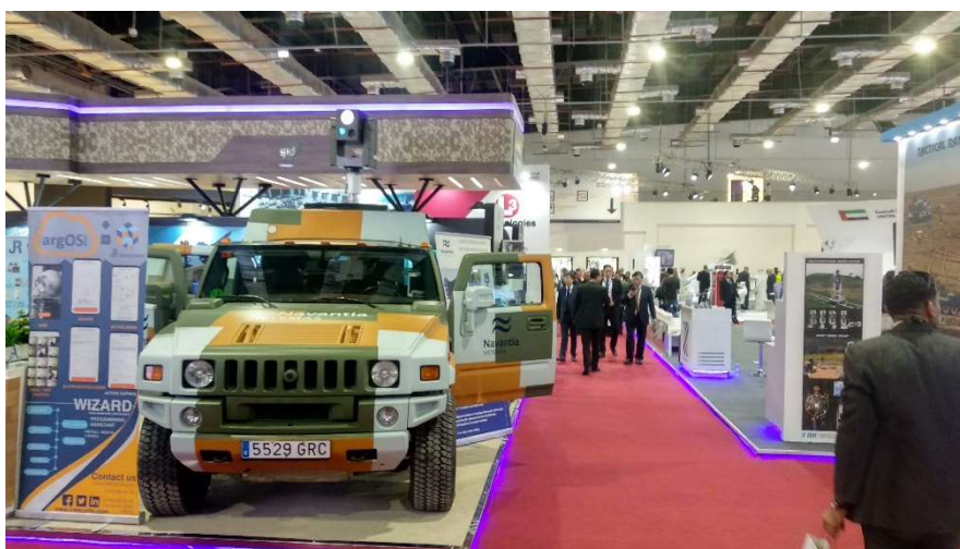
EDEX 2018.

En un futuro, EDEX quiere establecerse como una referencia del sector en la región MENA y así demostrar la capacidad de producción e innovación en el sector militar del país.