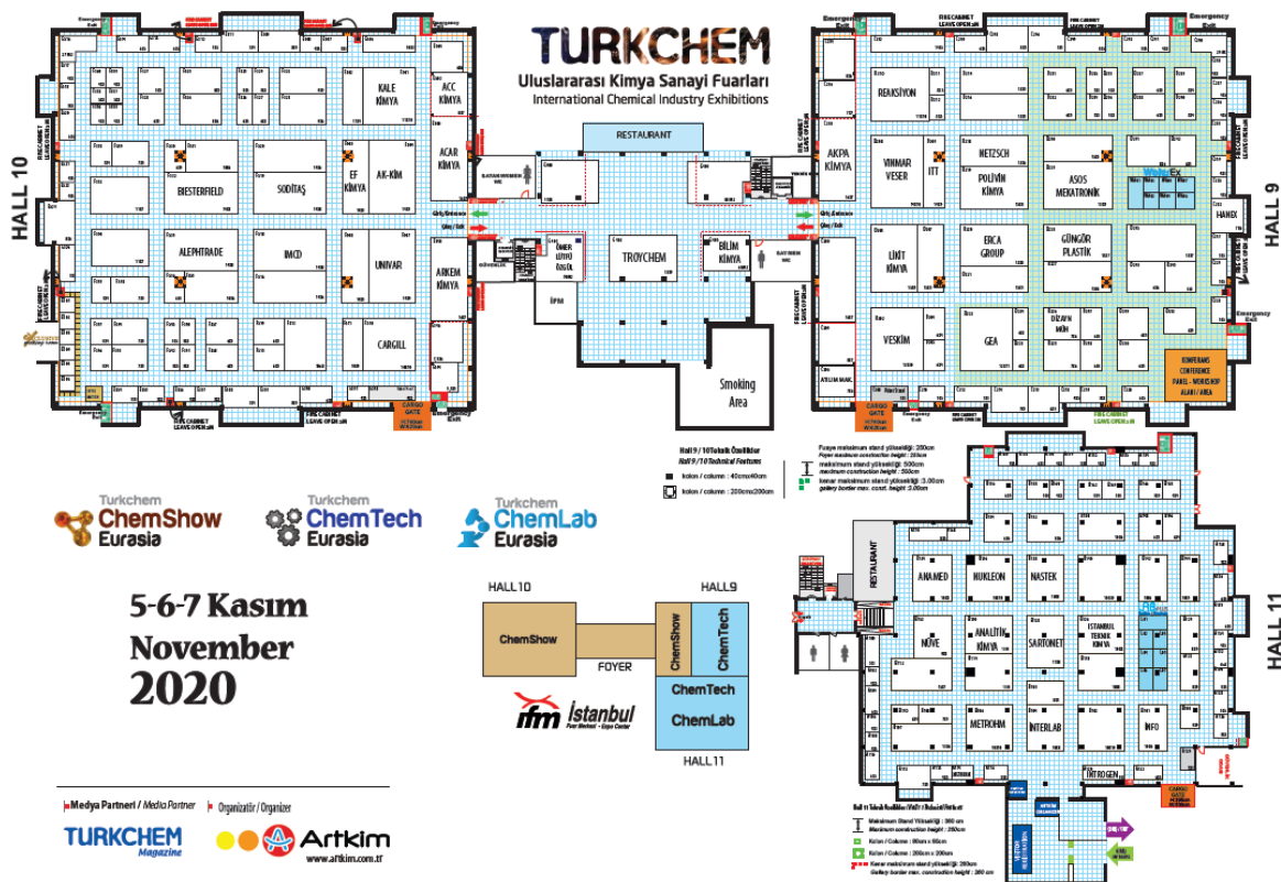
Imagen: Floor Plan TurkChem 2020

A continuación se puede ver el plano de la siguiente edición de TurkChem 2020: