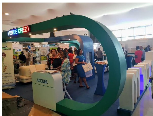
Imágenes de diferentes stands interiores en AFRICA SANTÉ EXPO 2019