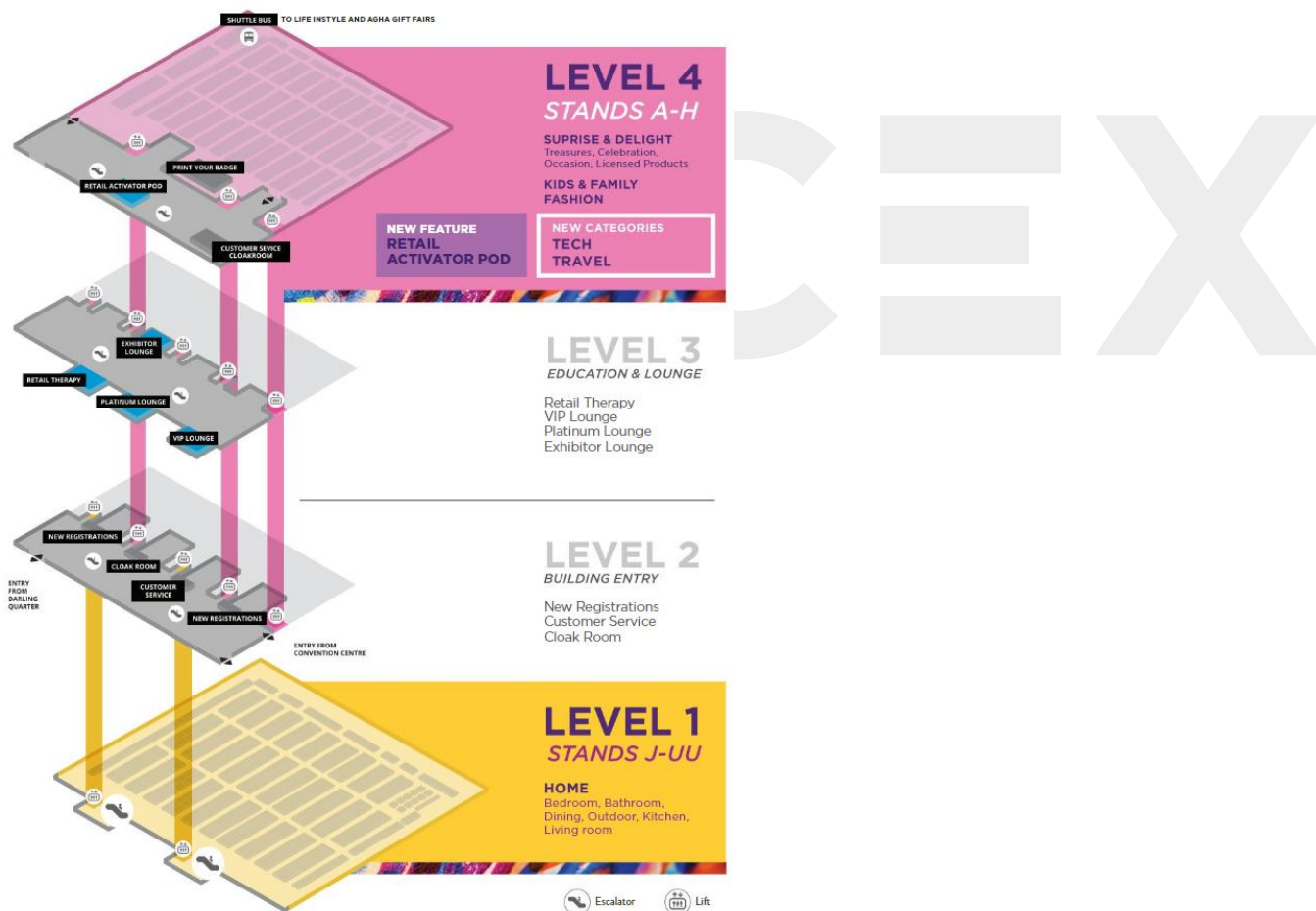
Plano del ICC Sydney Exhibition Centre.

Esta edición contó con un total de 505 expositores divididos en dos pisos situados en la primera y en la cuarta planta del ICC. Mientras que la entrada y las oficinas de registro y atención al cliente se encontraban en la segunda planta, en la tercera se situaba el denominado Education & Lounge , donde se situaba el espacio para la sala VIP y la sala para exhibidores.