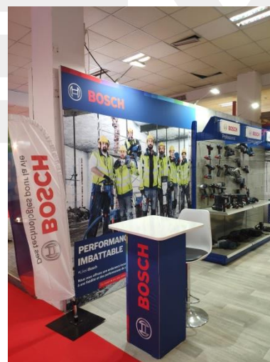
Fuente: Salon MEDIBAT 2019

En cuanto a la participación española, aunque anteriormente se había contado con algunas firmas con stand propio, este año sólo había dos distribuidores locales que contaban con sus productos: uno de ellos con Yale , y S.P.M.S. TUNISIE con Toledo . Ambos mostraron una gran satisfacción de trabajar con dichas firmas, así como respecto a la calidad y precio de sus productos.