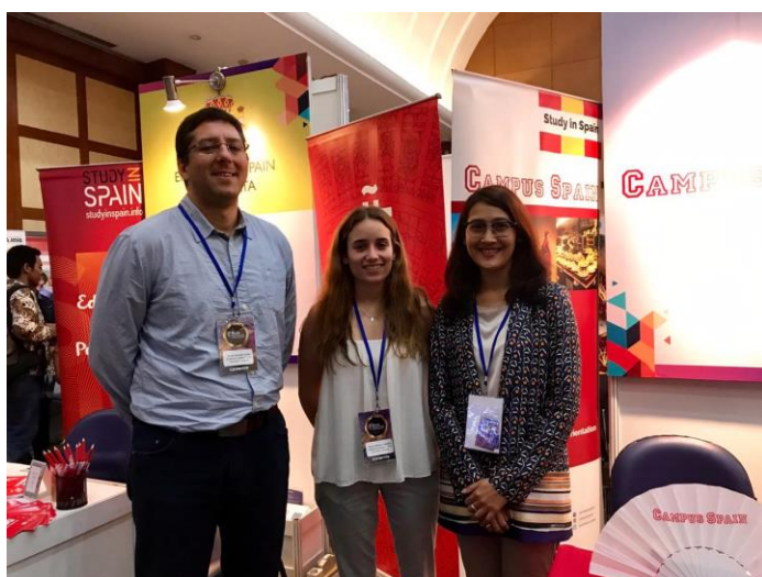
Representación del Instituto Cervantes, Oficina Comercial y Campus Spain.

La presencia de España en la feria fue mucho menor en comparación con otros países europeos, y en mayor medida comparado con otros países vecinos a Indonesia. Sólo una entidad educativa, Campus Spain, estuvo presente, además de la representación institucional por parte de la Oficina Comercial y el Instituto Cervantes.