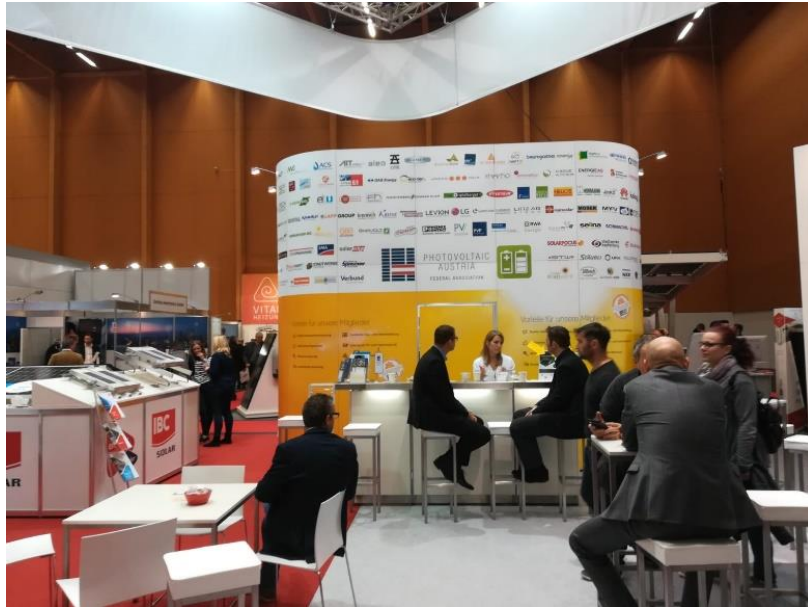
Ilustración 2: Expositor de Photovoltaic Austria