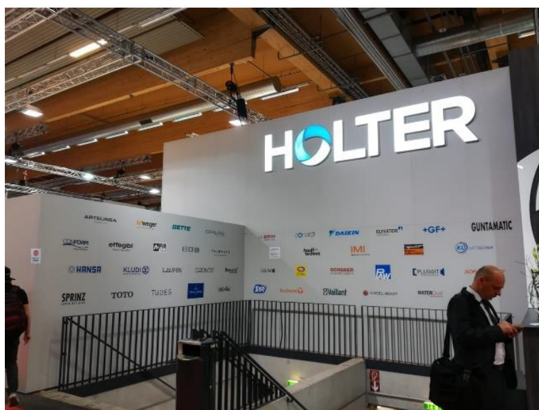
Ilustración 3: Cartel del expositor de Holter

Los principales productos que se exponen dentro de este ámbito son los sanitarios, el mobiliario de baño y la grifería. La oferta se extiende también a otro tipo de equipamientos interiores como cocinas y bienestar (saunas, solarios, piscinas, jacuzzis, etc.). Hay también representación de distribuidores de azulejos y piedra natural.