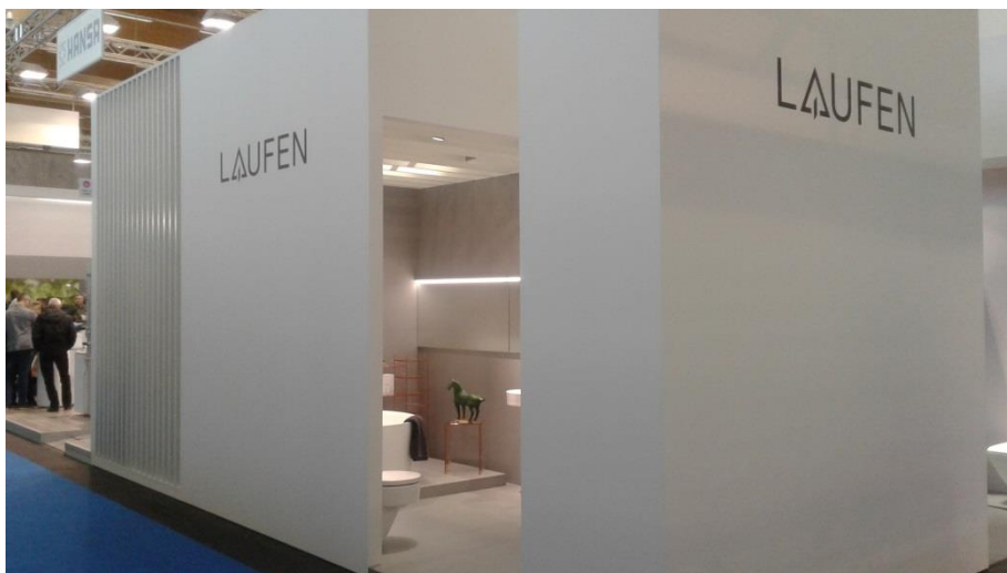
Ilustración 4: Expositor Laufen

En este sector, compete la empresa Laufen, filial de la empresa suiza Keramik Laufen y propiedad de la española Roca, que ofrece las últimas tendencias en diseño y calidad, muy apreciadas por el consumidor austriaco, y es líder del mercado.