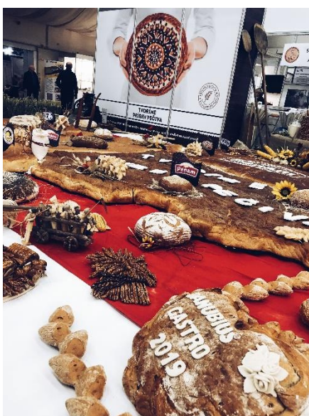
Exhibición de productos finales de la competición patrocinada por Metro y Fagor.

Entre las principales actividades que se realizan en la feria en cada edición, este año se contó con eventos muy atractivos como la competición de camareros en la Nestville Master Cup 77 2019 , en colaboración con Nestville , marca local de whiskey. Por otro lado, en colaboración con Metro , Fagor y la Asociación Eslovaca de Cocineros y Pasteleros , se preparó un stand de exhibición de los productos ganadores del concurso de panadería. Dentro de la feria, como en cada edición, se llevaron a cabo competiciones profesionales que fueron galardonadas con el premio Danubius Gastro 2019 , con el que a su vez también premiaron a las mejores exposiciones y mas novedosas, entre las cuales se encontraron el chocolate rubí , la presentación sobre vivir de manera saludable con producto nacional y las ultimas tendencias en robots de cocina.