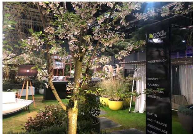
Foto tomada en la visita a la feria

" Natural Living " es el eslogan de este año, y está presente en todas las tendencias presentadas. De hecho, los materiales naturales están a la orden del día, con la madera como protagonista. Además, hay una gran demanda de cuero curtido, corcho y fibras naturales, desde coco hasta algodón y lino. Por otro lado, se prefieren los productos locales en el sentido de un "sello verde". Los fabricantes austriacos, en particular, están a la cabeza presentando productos de alta calidad y con un diseño innovador.