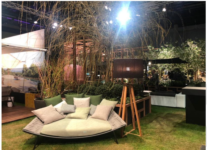
Foto tomada durante la visita a la feria

Por ello, los muebles prácticos son especialmente solicitados: soluciones inteligentes, muebles plegables, desde la mesa de comedor hasta la mesa de bar, desde el taburete hasta la mesa auxiliar o las variantes de estanterías apilables.