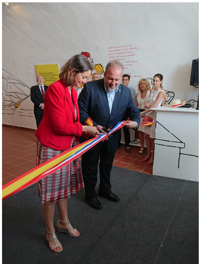
La Ministra Maroto junto con el Ministro Marrero, en el protocolario corte de cinta del pabellón español.

Por último, se celebró una cena especial dedicada a España como país invitado de honor en el Hotel Packard del Grupo Iberostar.