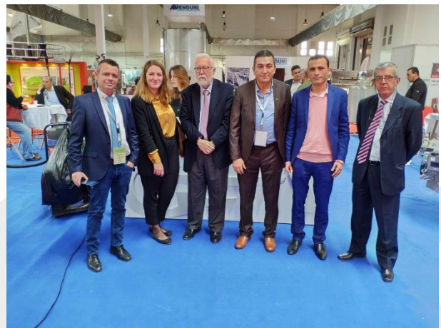
Fuente: Fotografías realizadas en MED MAG OLIVA 2019, Sousse